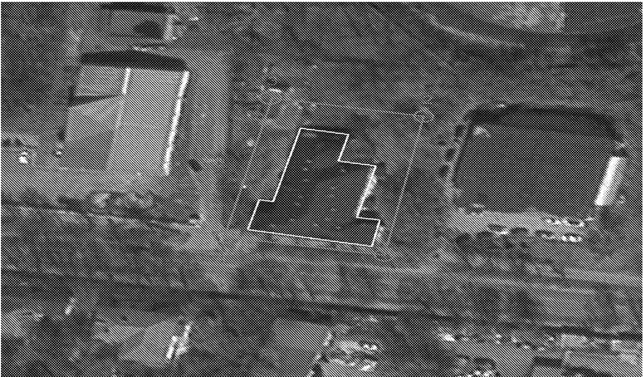
Схема границ территории объекта культурного наследия

Границы территории объекта культурного наследия регионального значения «Дом жилой (деревянный)» по адресу: г. Пенза, ул. Лермонтова, д.13