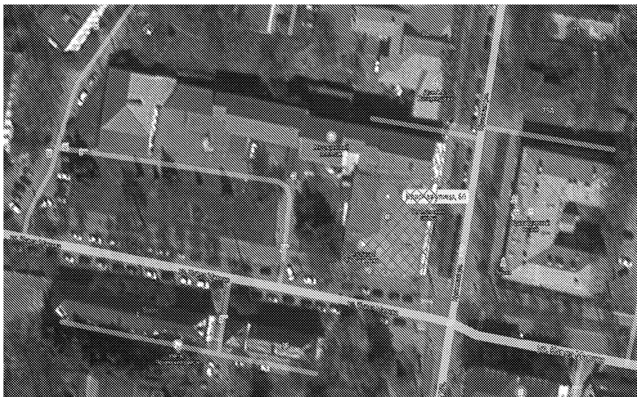
Схема границ территории объекта культурного наследия

Границы территории объекта культурного наследия регионального значения «Здание бывшего клуба Соединенного собрания, где: в 1918–1928 годах размещался Пензенский городской Совет первого созыва, в 1923 году – первый в г. Пензе Центральный клуб пионеров; выступали: в 1914 году – поэт В.В.Маяковский, в 1918 году – один из политических руководителей Красной Армии, затем председатель ЦКК и нарком РКИ, член Политбюро ЦК ВКП(б), член ВЦИК, ЦИК СССР В.В.Куйбышев» по адресу: г. Пенза, ул. Красная, 60