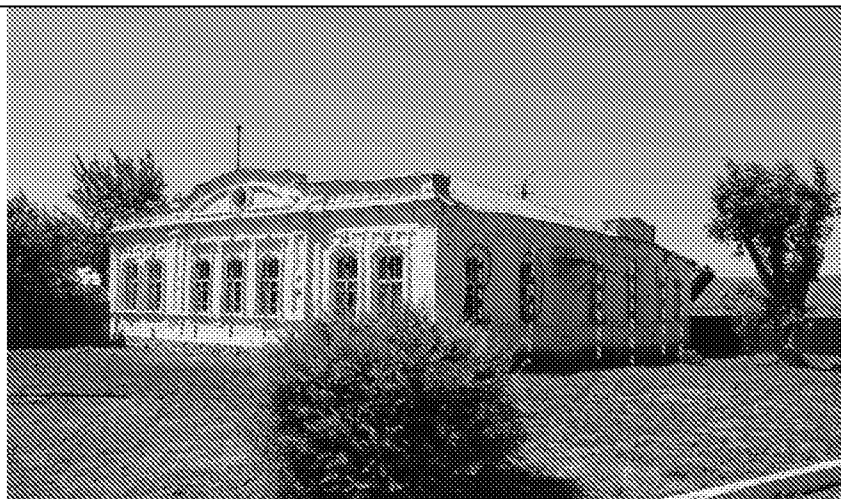
Западный фасад(13 световых осей), Южный фасад (2 свтотвые оси)

5. Исторические (нач. XIX в.) габариты наружных оконных проемов восточного, северного и южного фасадов здания;