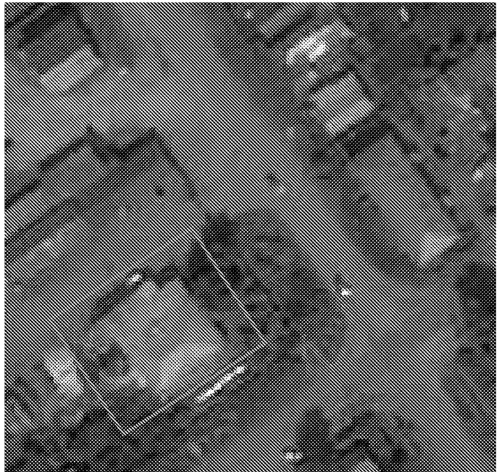
Прямоугольное в плане здание

2. Историческая (нач. XIX в.) архитектурная композиция здания;