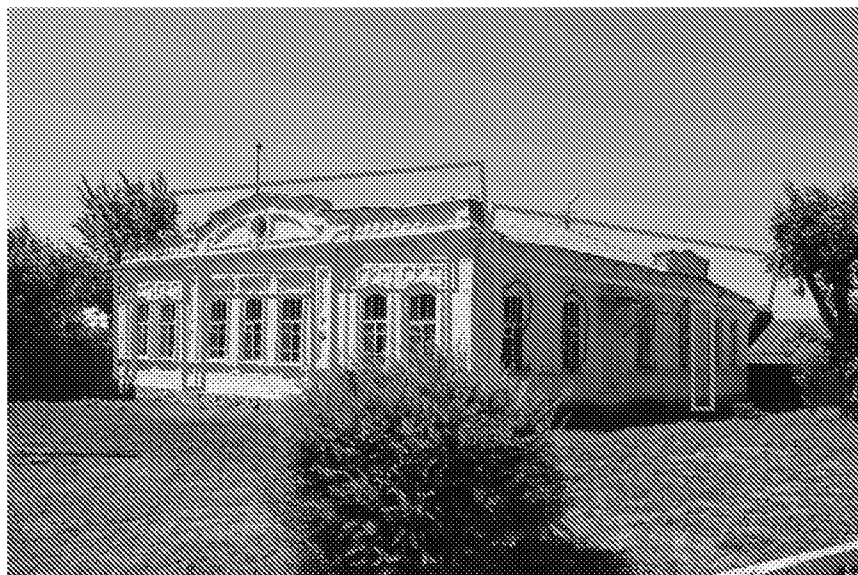
Вертикальные пилоны и горизонтальные тяги