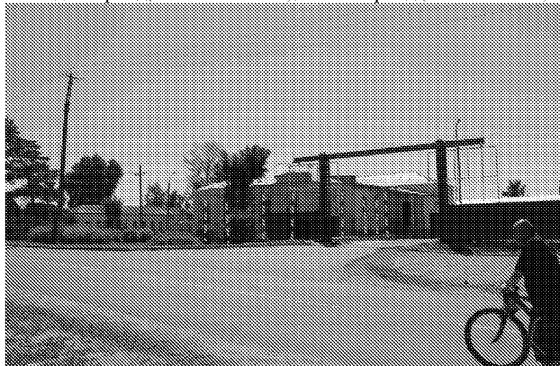
Северный фасад(8 световых оси)