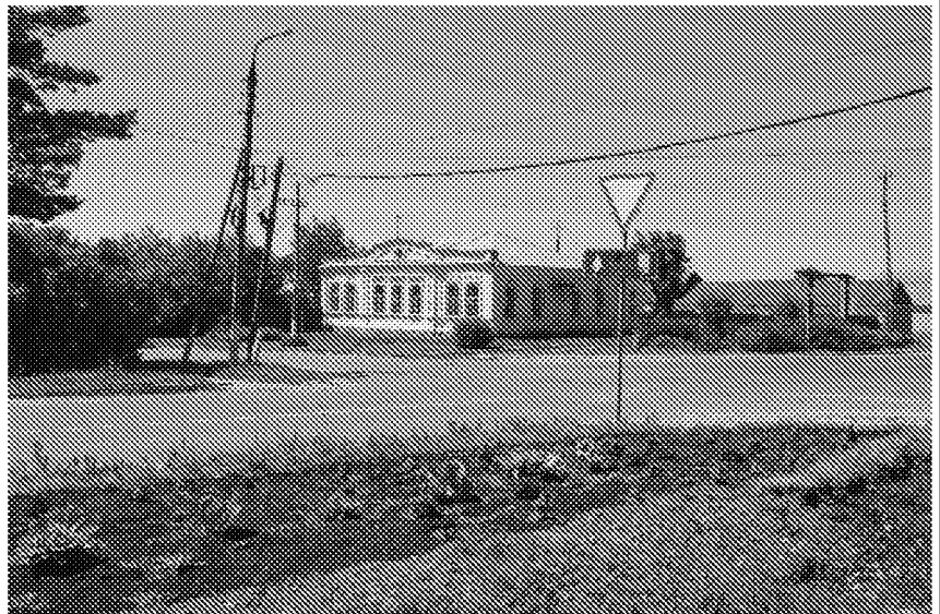
Историческая архитектурная композиция здания продиктованная стилем модерн и классицизм.

2. Историческая (нач. XIX в.) архитектурная композиция здания;