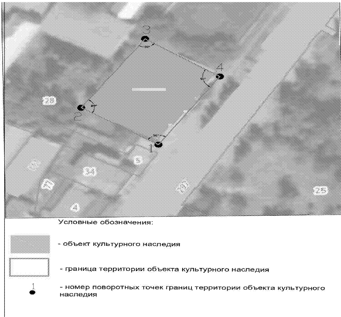
Схема границ территории объекта культурного наследия

Границы территории объекта культурного наследия регионального значения «Здание, где с 1918 г. размещался Совет рабочих, солдатских и крестьянских депутатов» по адресу: Пензенская область, Спасский район, г. Спасск, Советская пл., 6