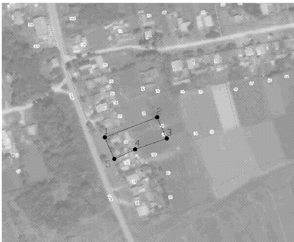
Схема границ территории объекта культурного наследия

Границы территории объекта культурного наследия регионального значения «Дом, в котором с 1921 по 1929 гг. жил Герой Советского Союза А.Е. Махалин» по адресу: Пензенская область, Кузнецкий район, с. Махалино, ул. Махалина, 15