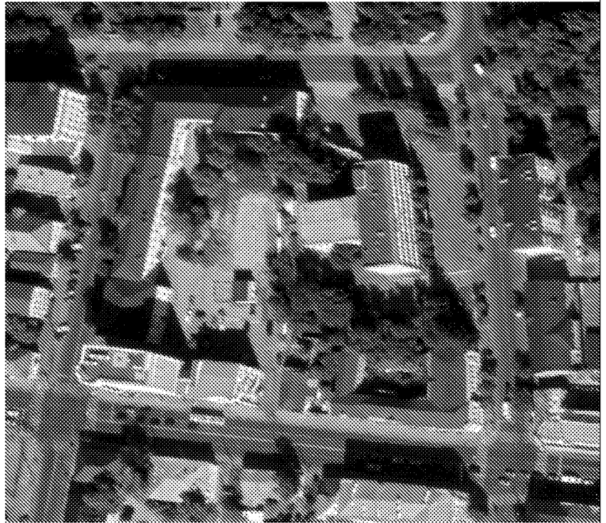
Прямоугольное в плане здание

3. Историческая (начало XX в) архитектурная композиция здания;