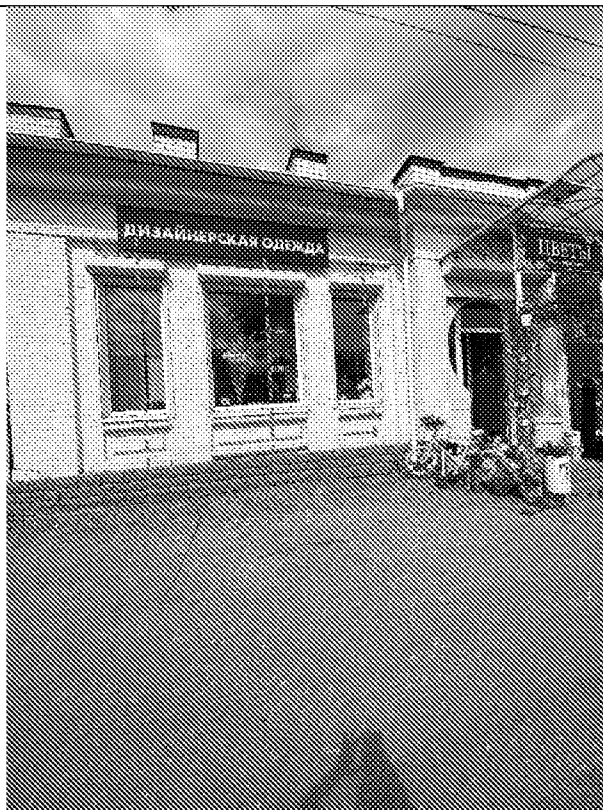
Южный фасад(3 световых осей)

5. Исторические (начало XX в) габариты наружных оконных проемов западного, южного фасадов здания;