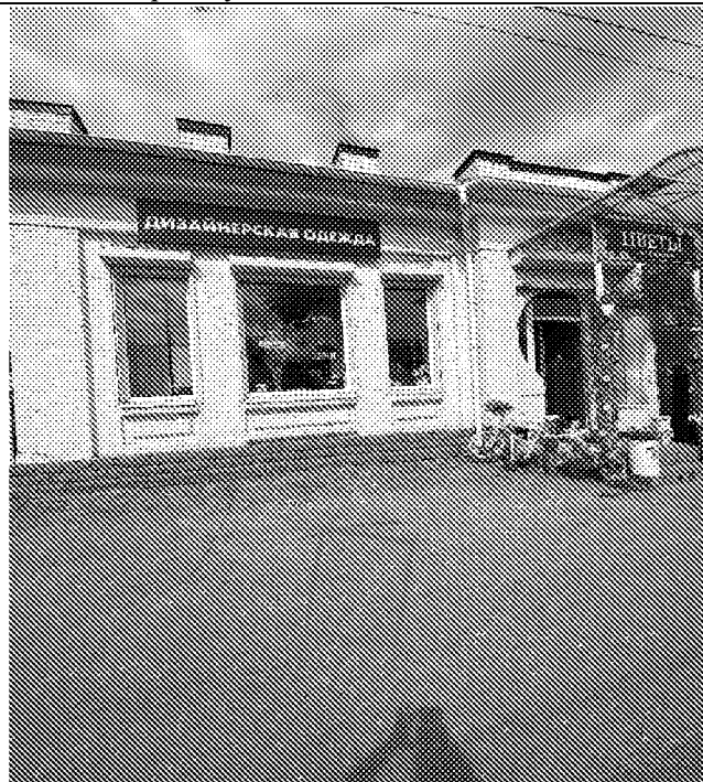
Историческая архитектурная композиция здания продиктованная стилем модерн.

3. Историческая (начало XX в) архитектурная композиция здания;