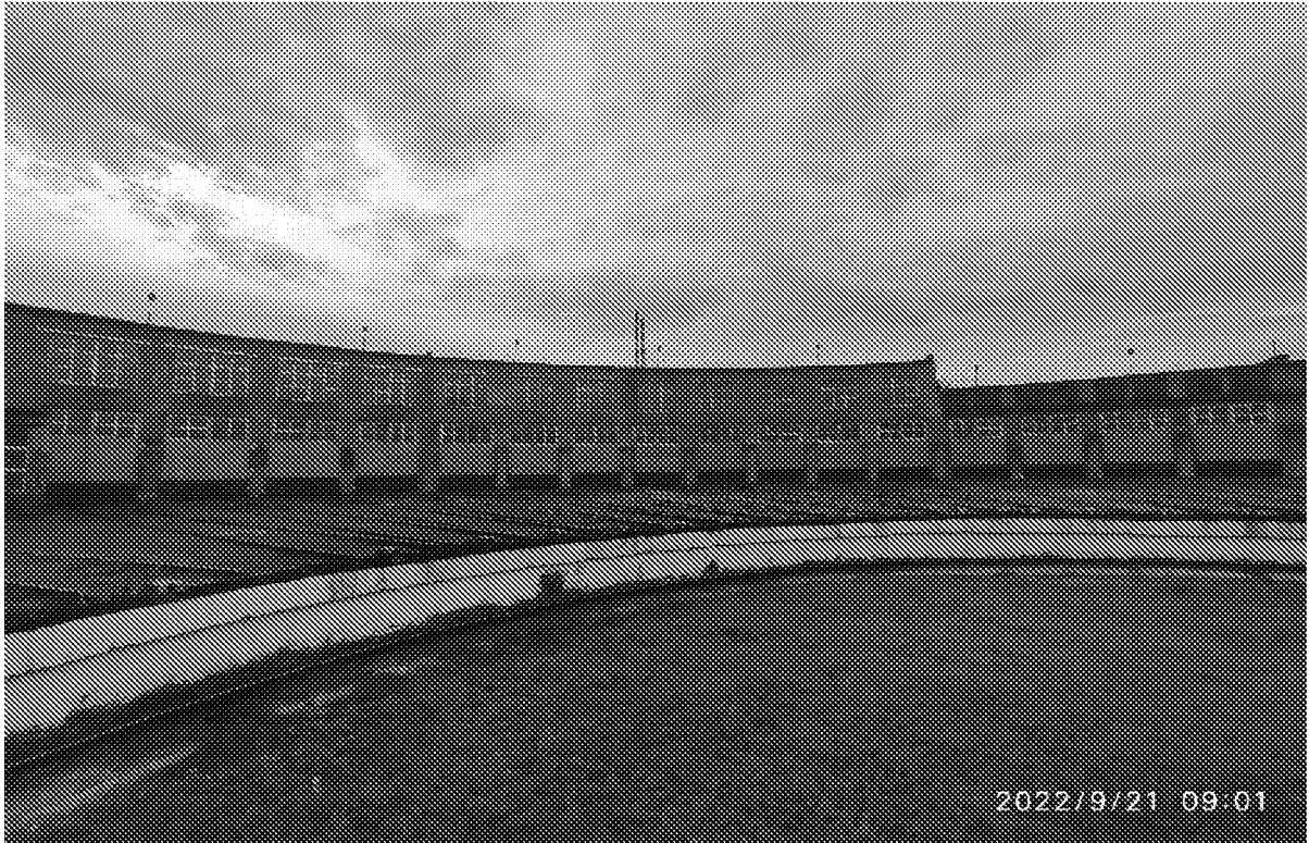
Вид на объект культурного наследия с северной стороны (21.09.2022)