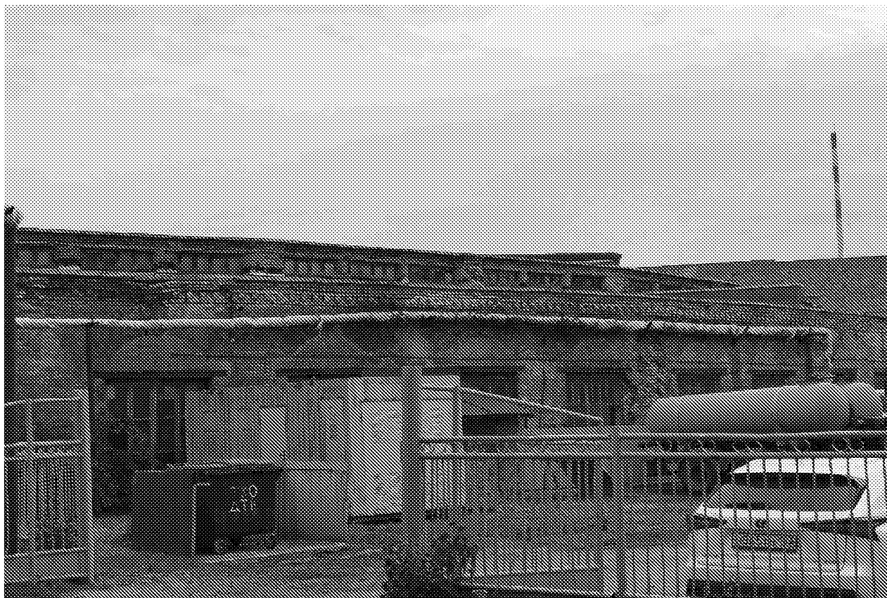
Вид на объект культурного наследия с юго-западной стороны. (21.09.2022)