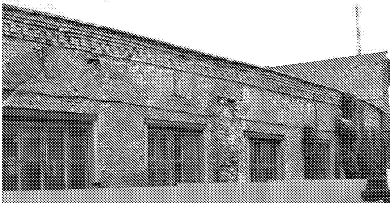
Вид на часть фасада объекта культурного наследия с южной стороны. (21.09.2022)