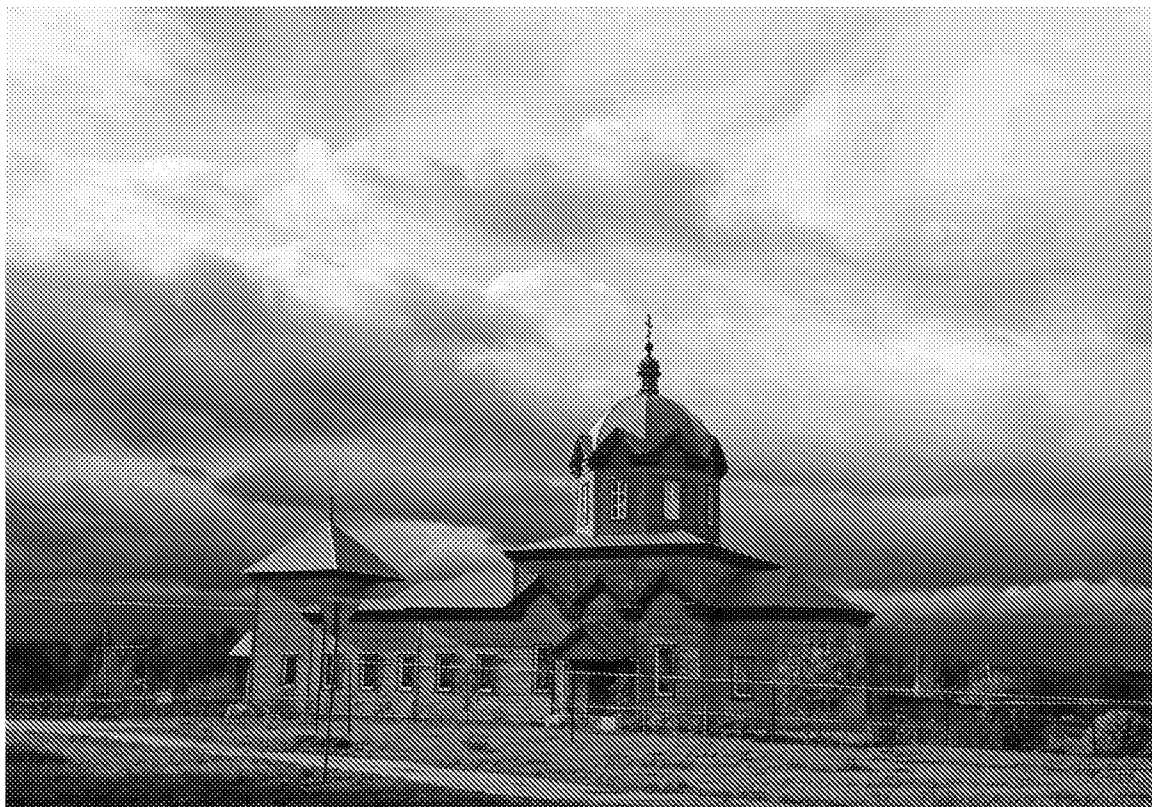
Вид на объект культурного наследия с южной стороны (07.10.2022)