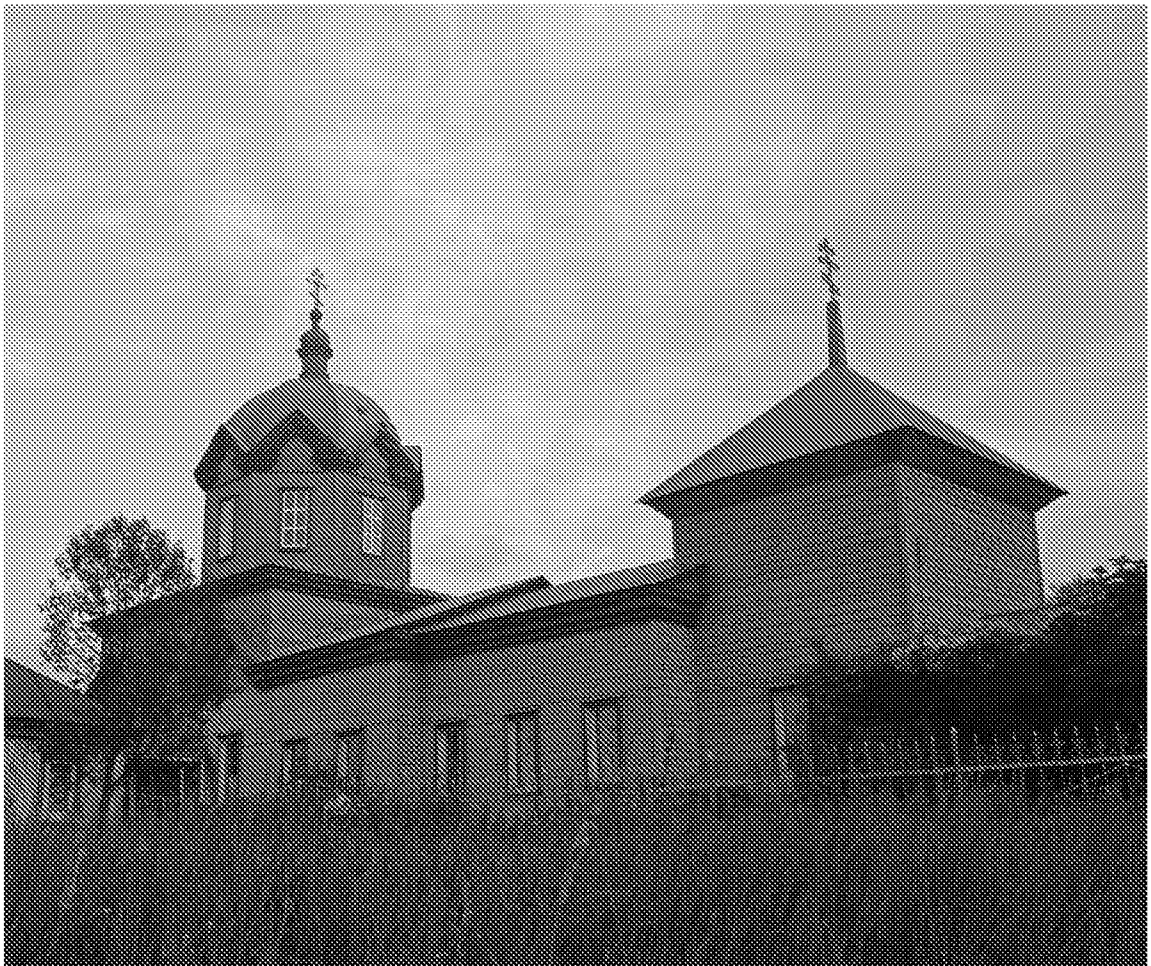
Вид на объект культурного наследия с северной стороны. (07.10.2022)