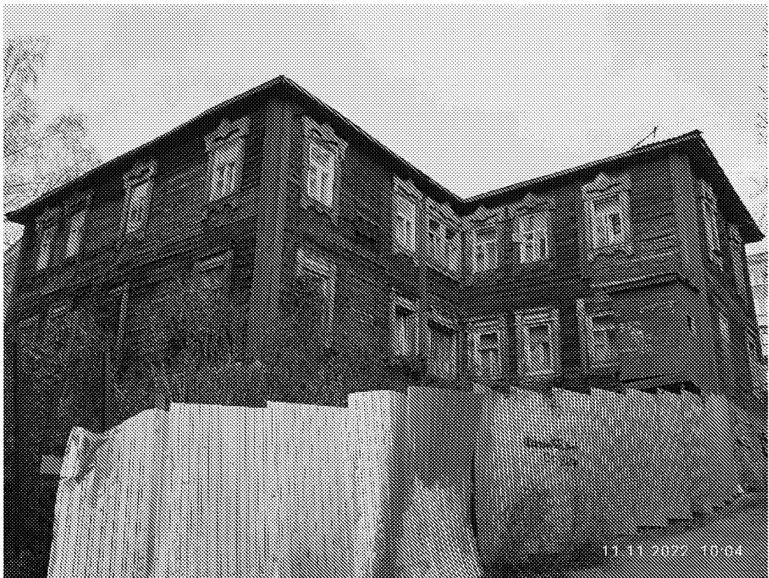
Вид на объект культурного наследия с юго-восточной стороны. (11.11.2022)