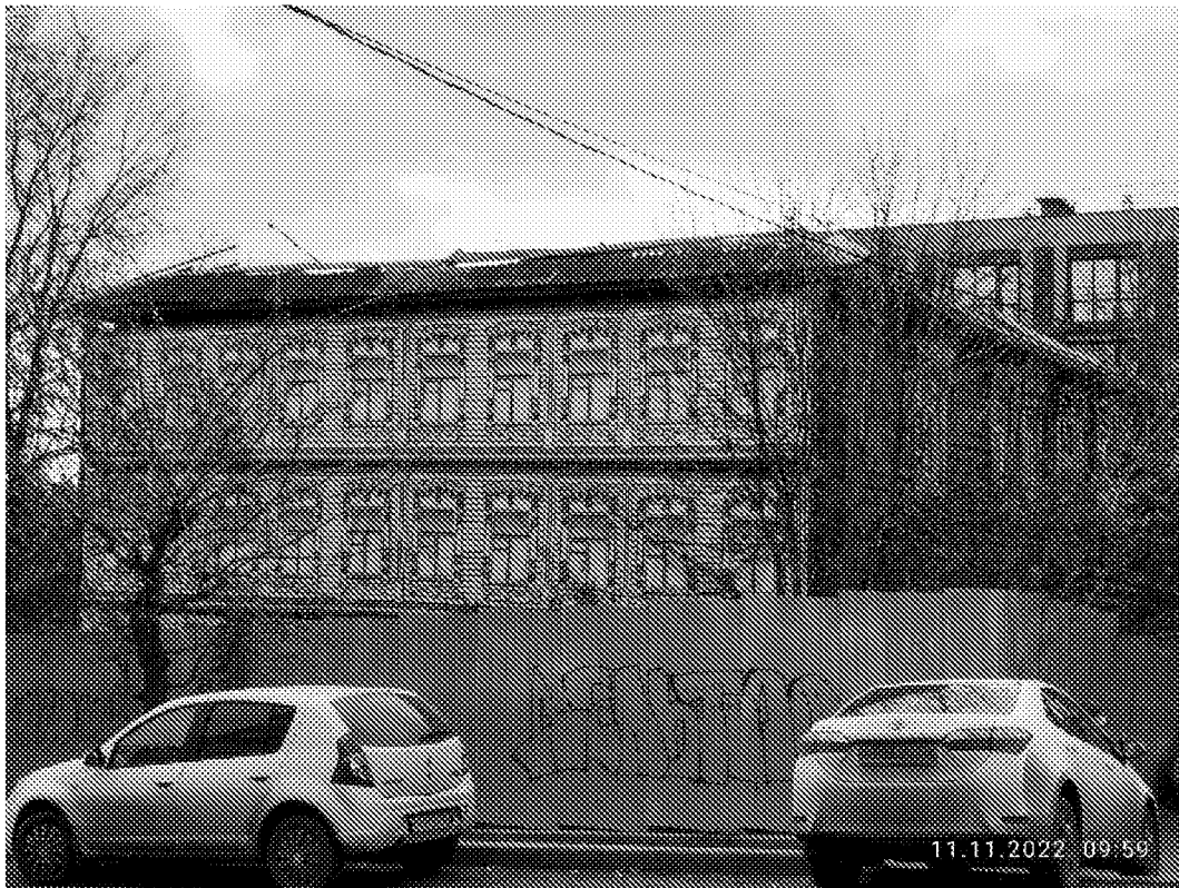
Вид на объект культурного наследия с северной стороны (11.11.2022)