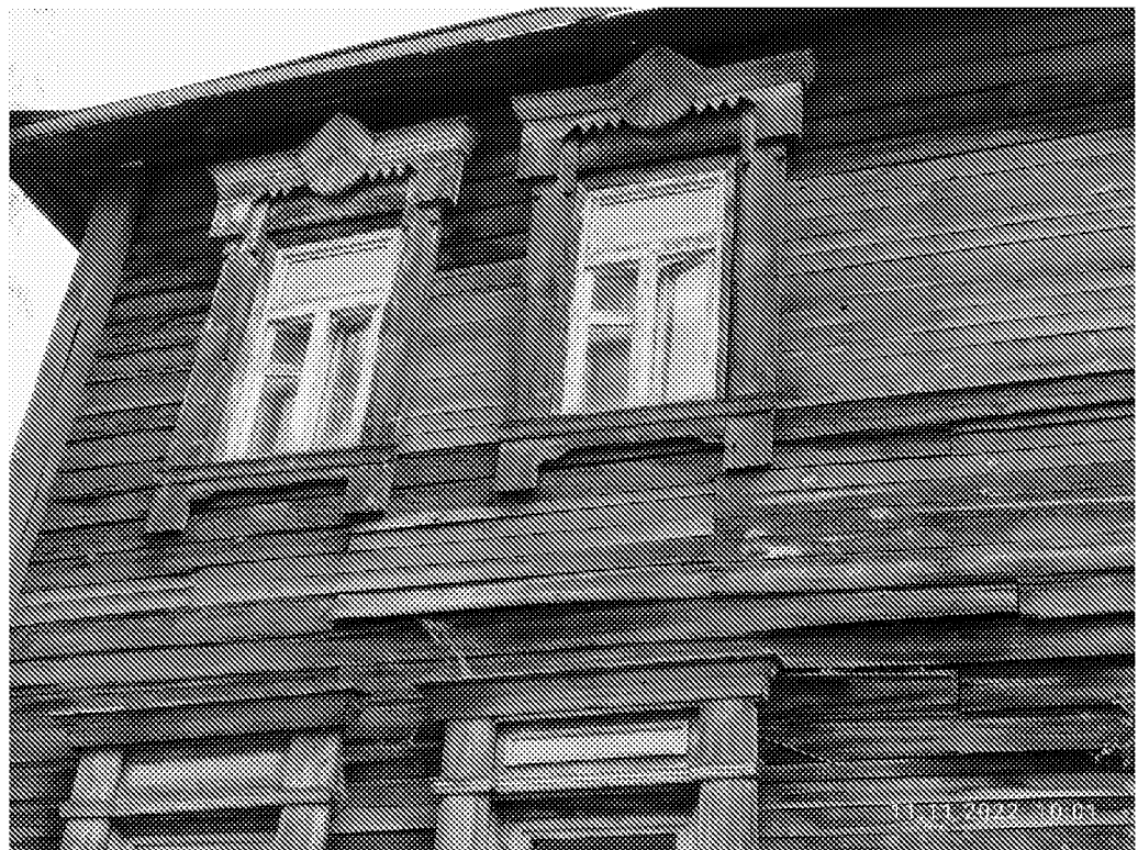
Вид на разрушения фасада объект культурного наследия (11.11.2022)