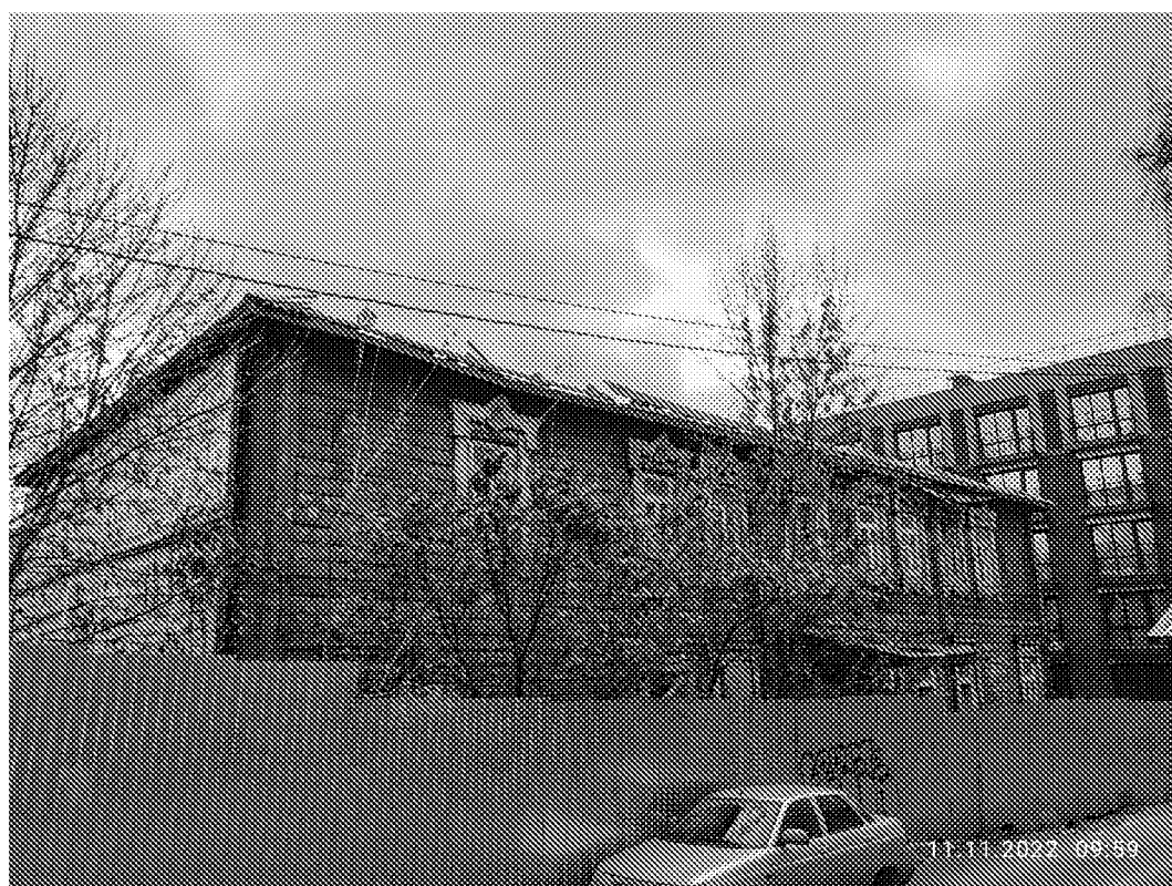
Вид на объект культурного наследия с западной стороны (11.11.2022)