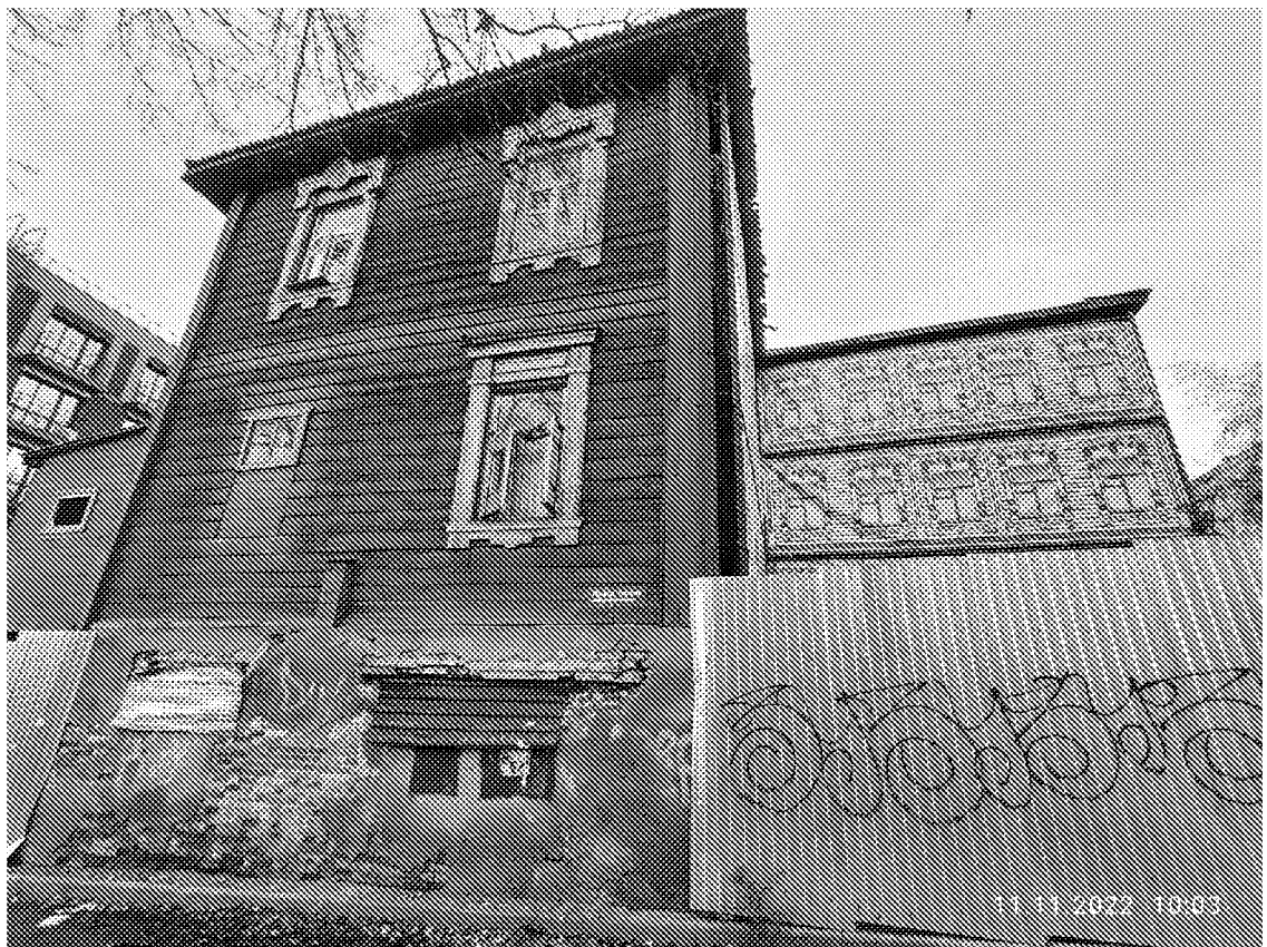
Вид на объект культурного наследия с восточной стороны (11.11.2022)