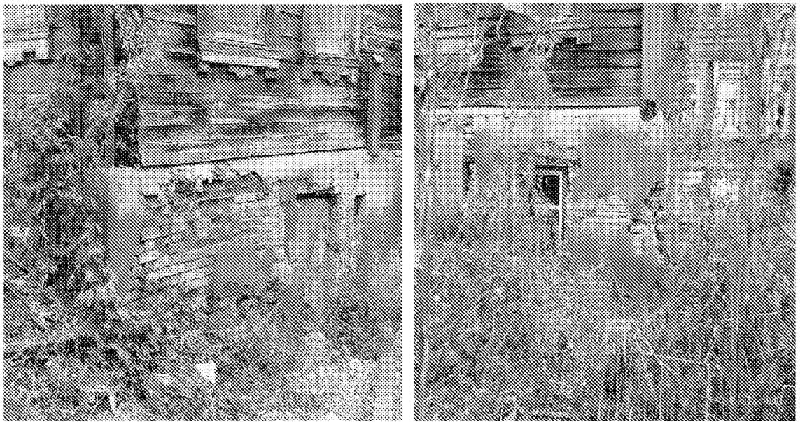
Вид на разрушения цоколя объект культурного наследия (11.11.2022)