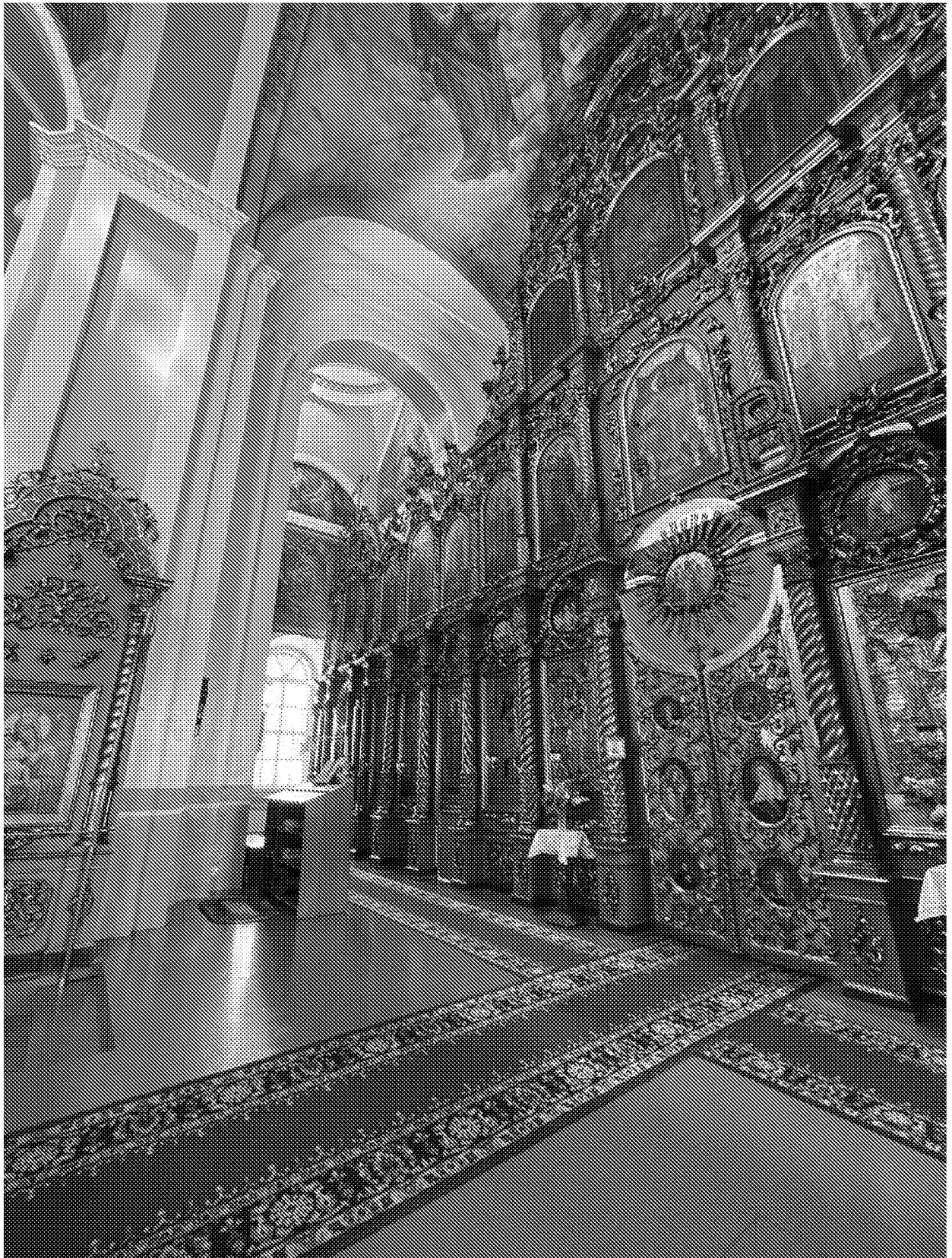
Фрагмент интерьера (иконостас) объекта культурного наследия