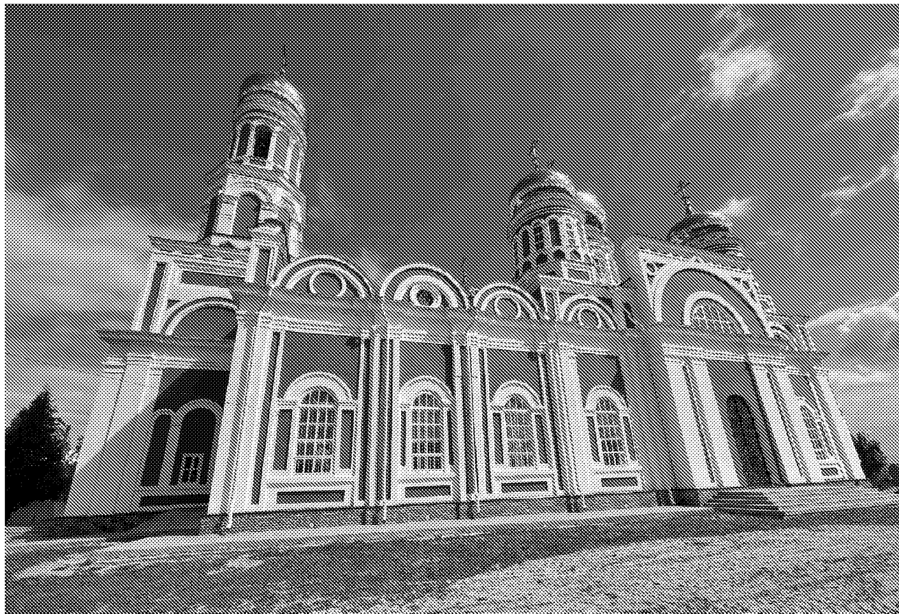
Южный фасад объекта культурного наследия