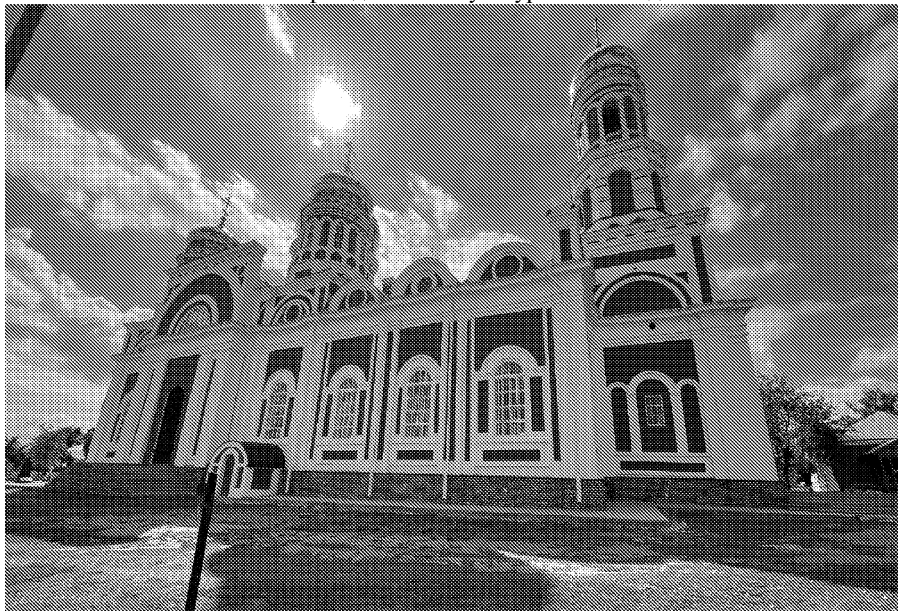
Северный фасад объекта культурного наследия