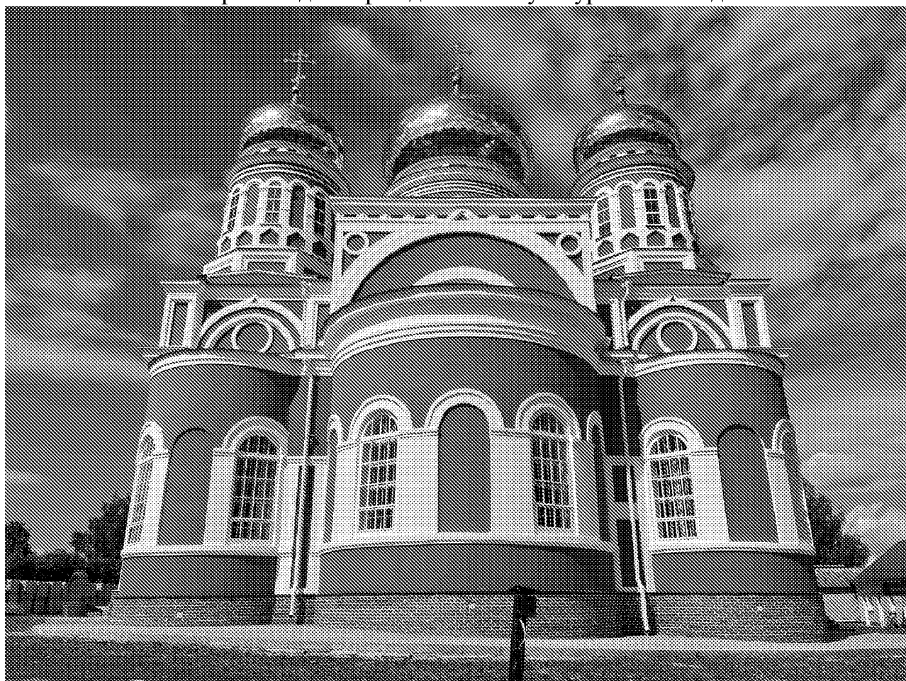
Восточный фасад объекта культурного наследия