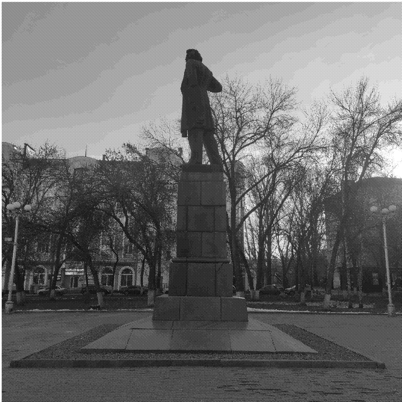
Вид на объект культурного наследия с северной стороны (08.12.2022 г.)