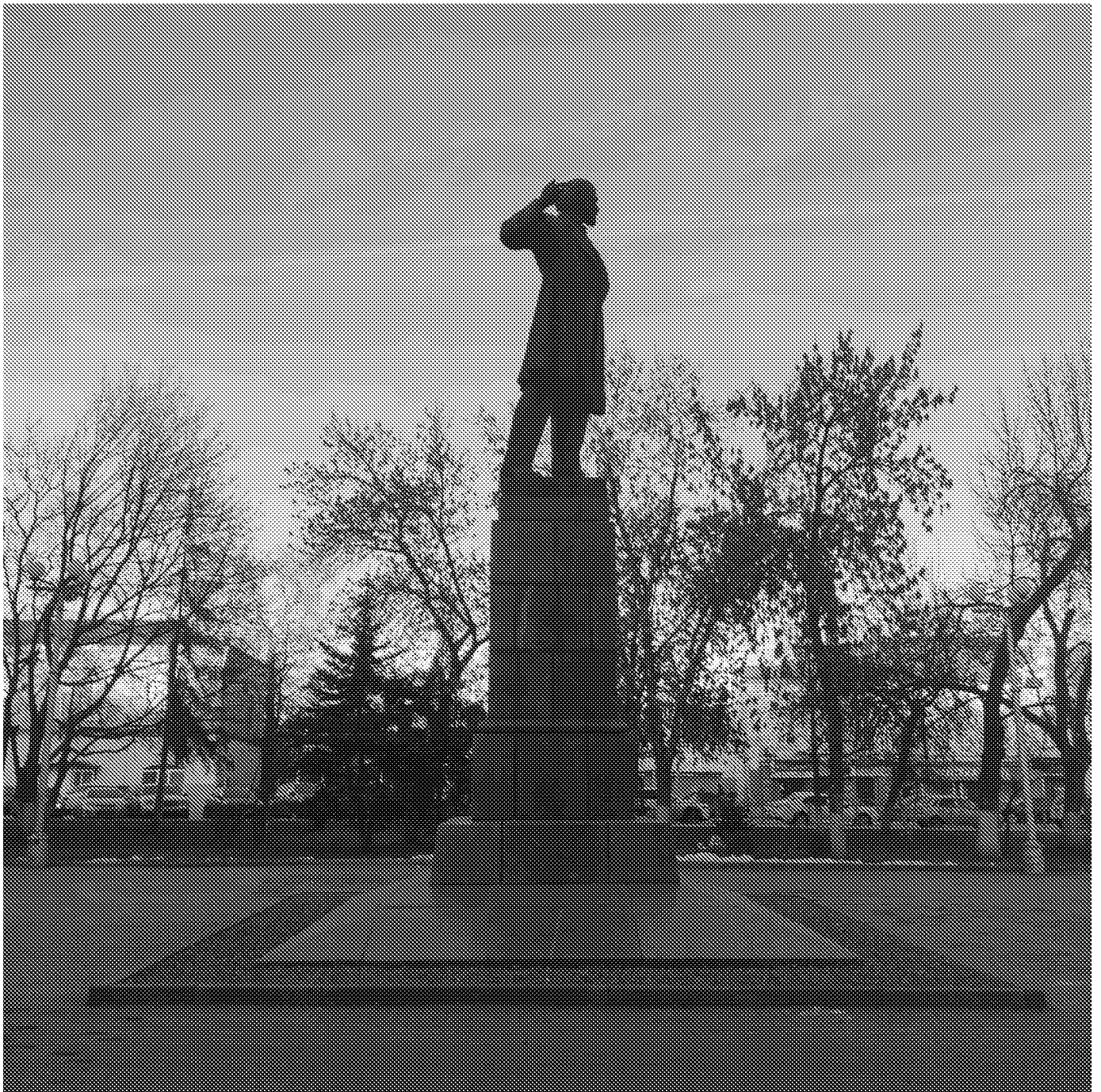
Вид на объект культурного наследия с южной стороны (08.12.2022)