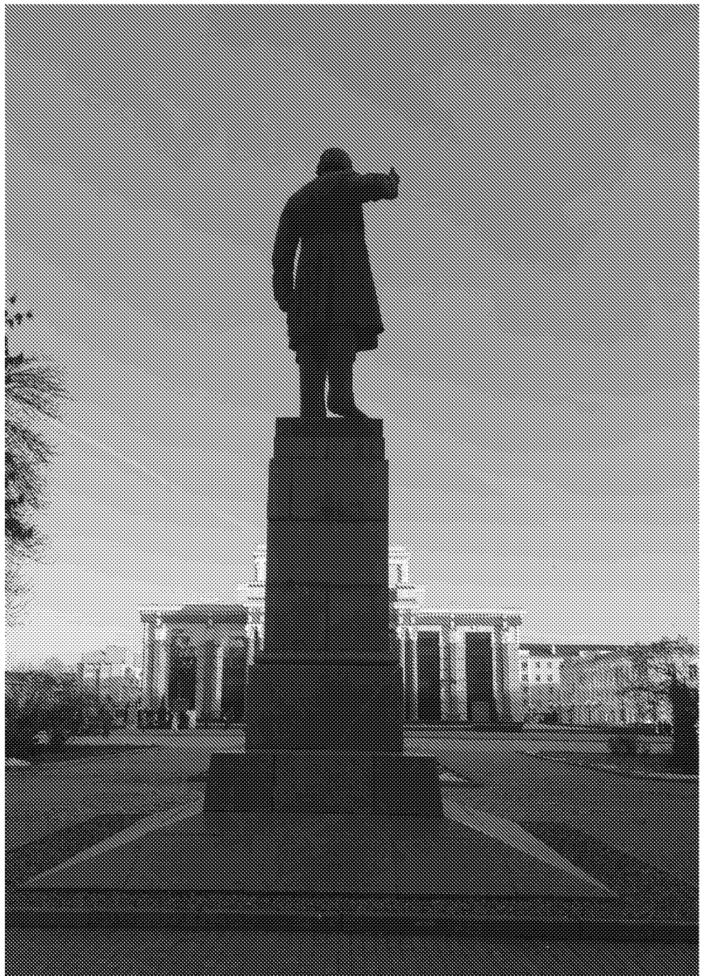
Вид на объект культурного наследия с западной стороны (08.12.2022 г.)