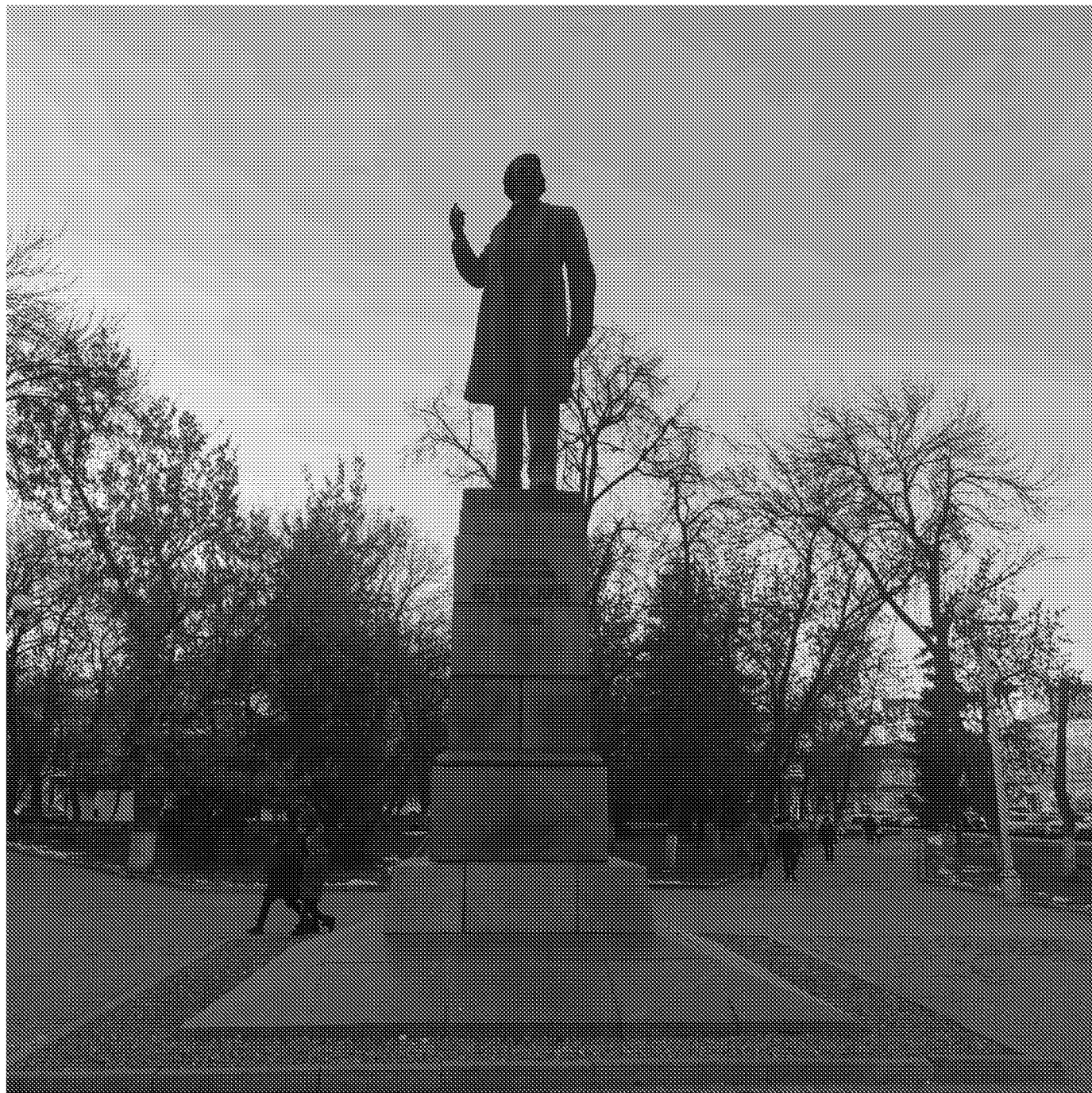
Вид на объект культурного наследия с восточной стороны (08.12.2022 г.)