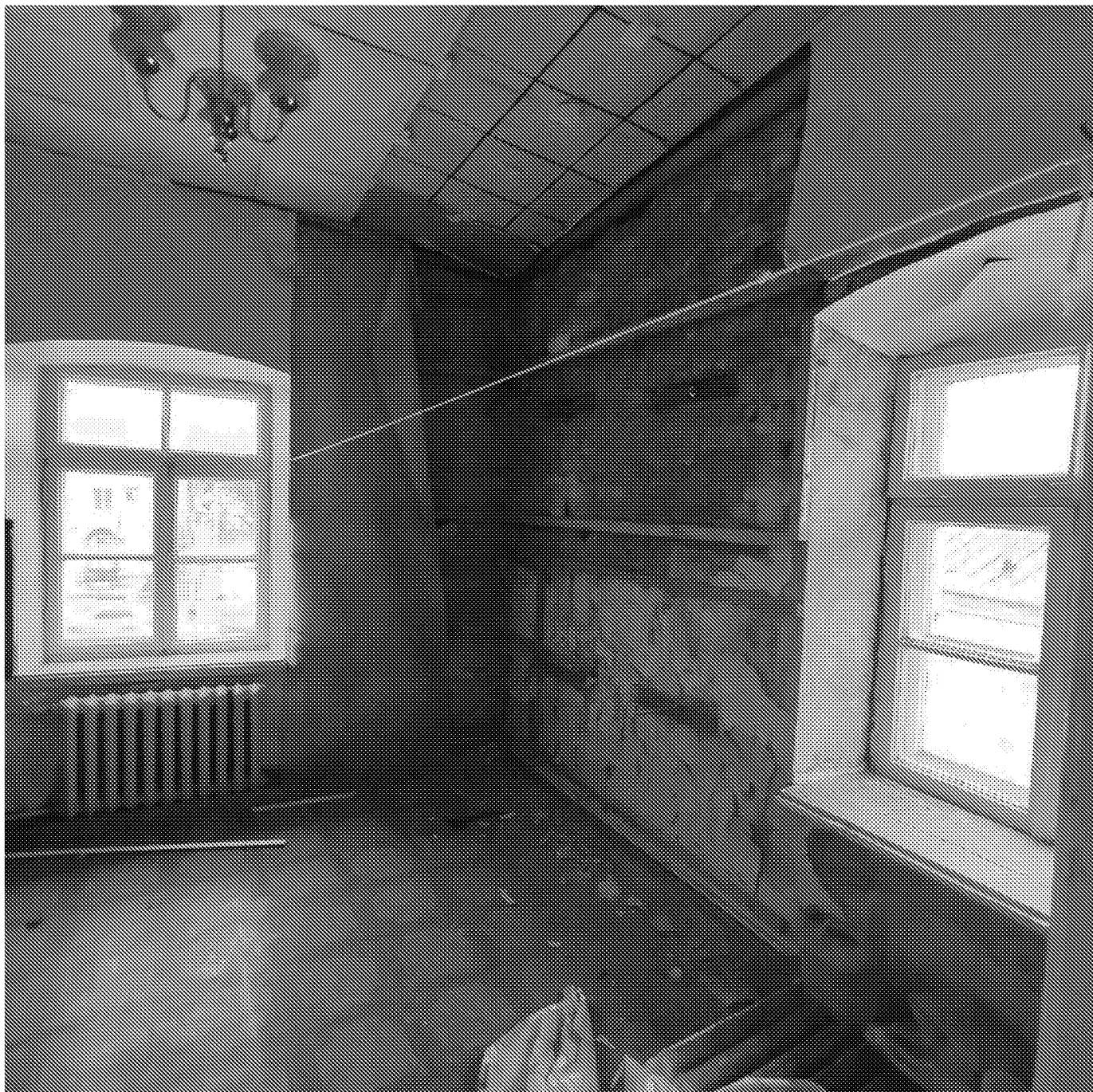
Фрагмент помещения третьего этажа (23.12.2022)