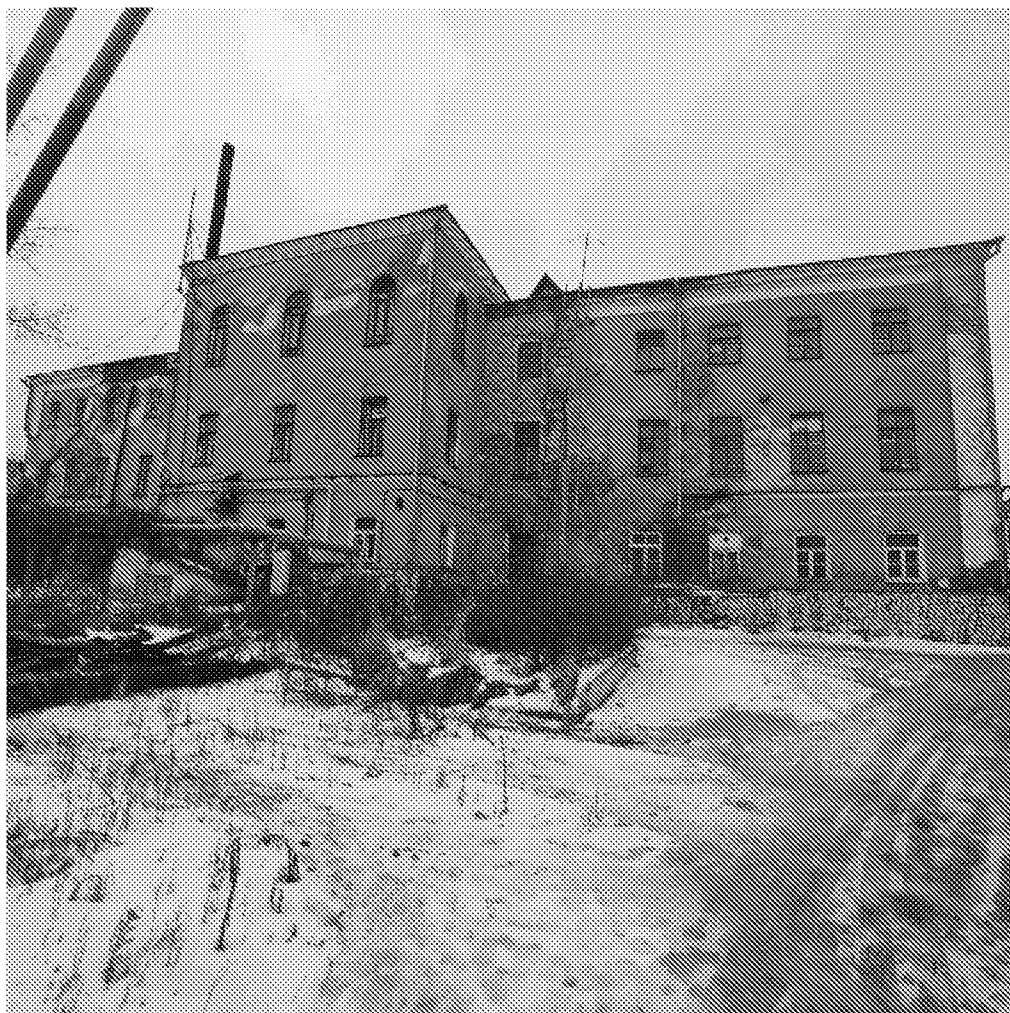
Дворовый (восточный) фасад здания (23.12.2022)