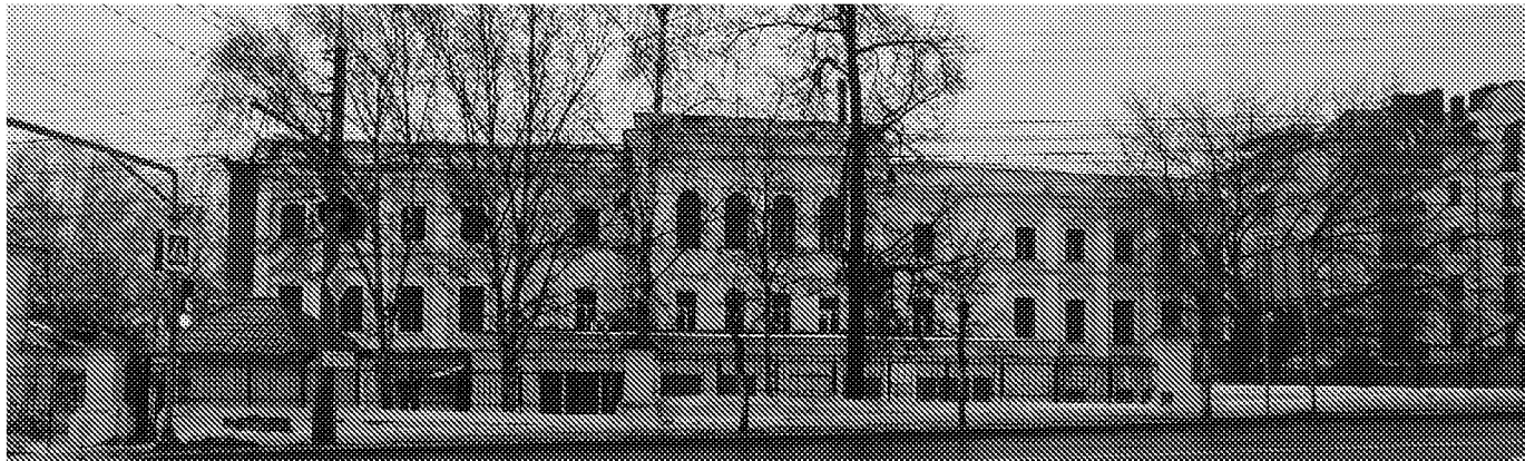
Главный (западный) фасад здания по ул. Кирова (23.12.2022)