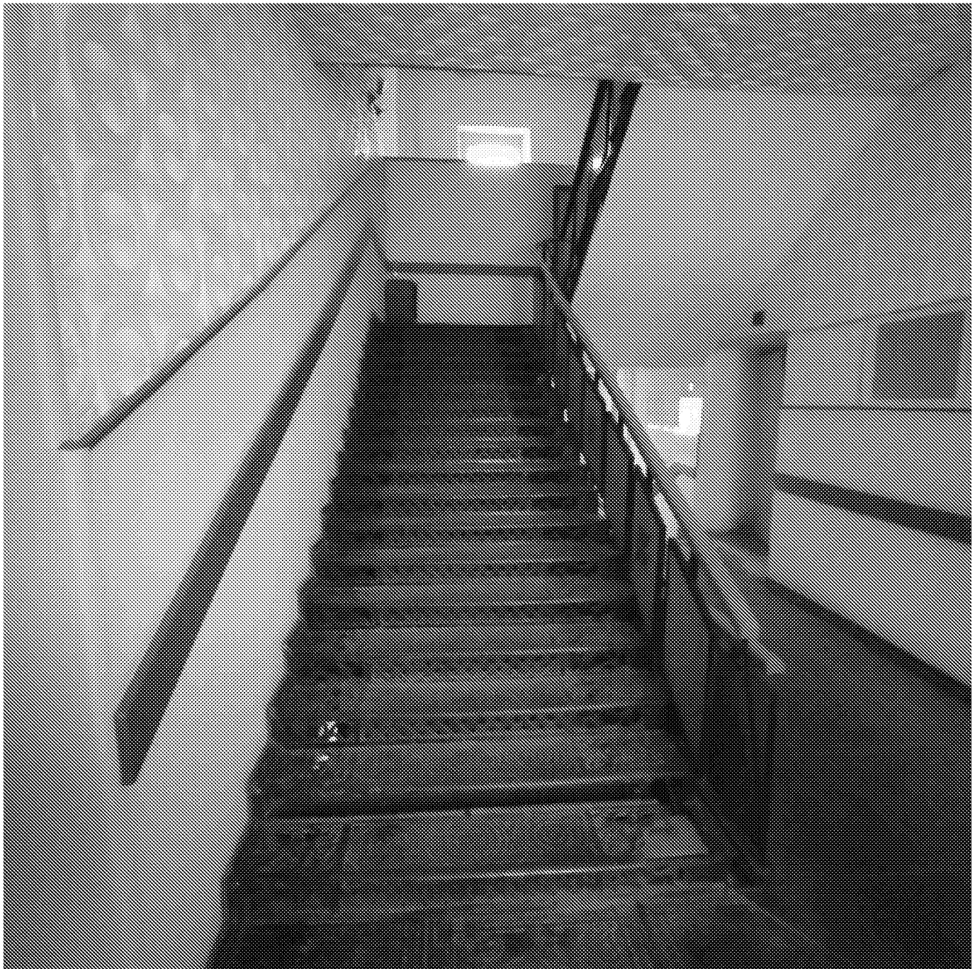
Фрагмент чугунной лестницы (23.12.2022)