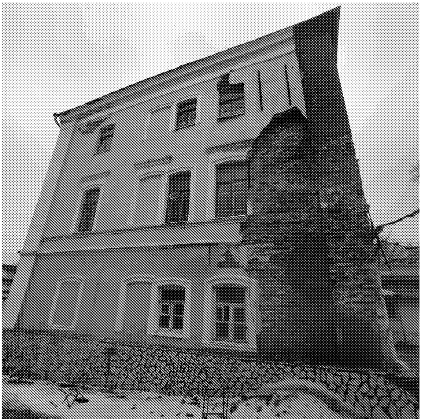
Северный фасад здания (23.12.2022)