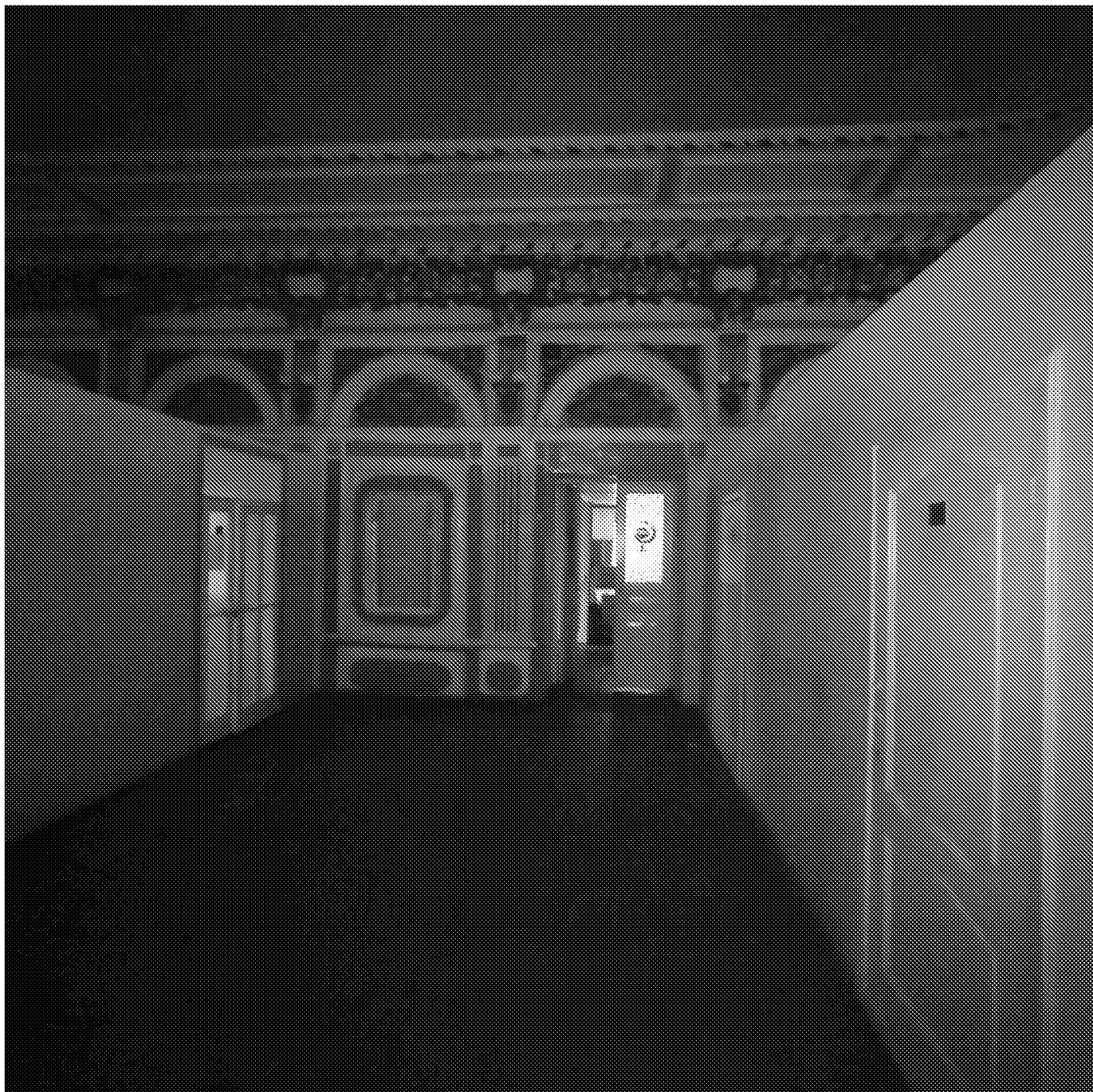
Фрагмент парадного зала третьего этажа (23.12.2022)