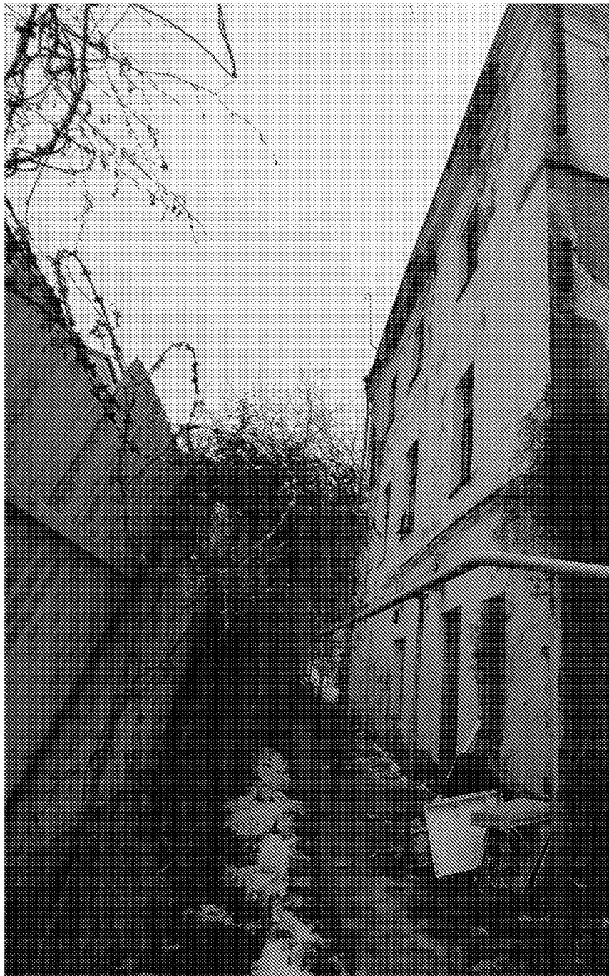
Южный фасад здания (23.12.2022)