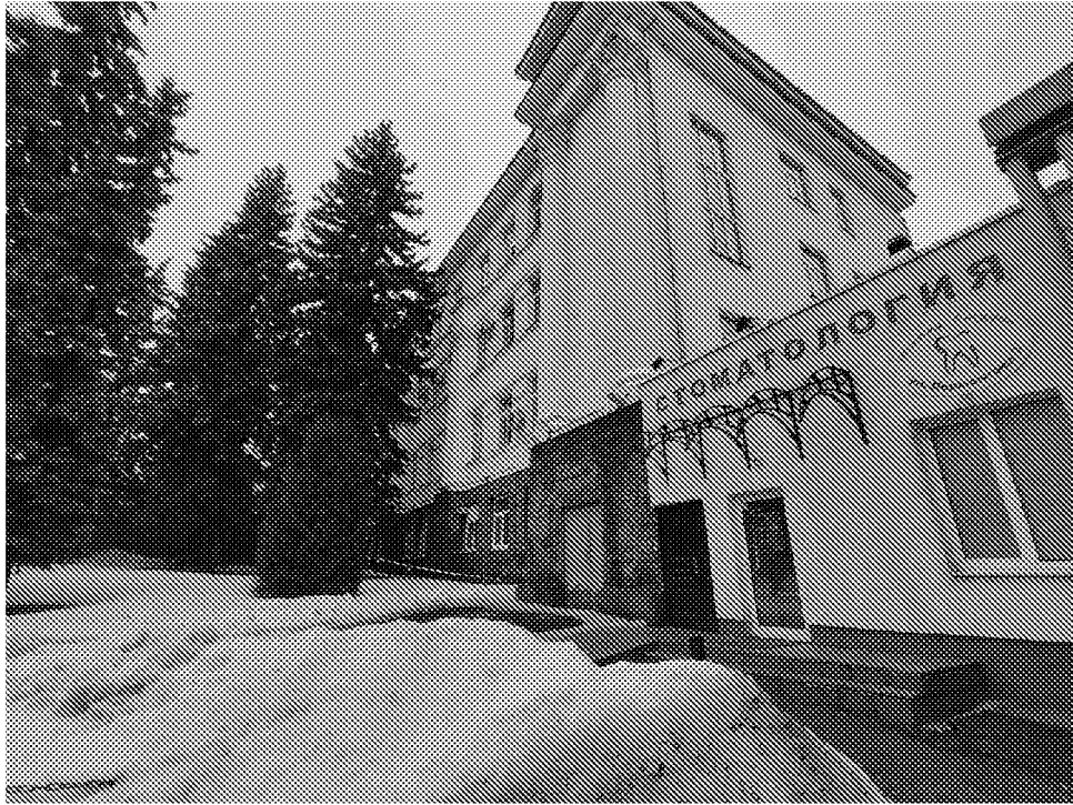
Вид на объект культурного наследия с юго-восточной стороны (09.03.2023)