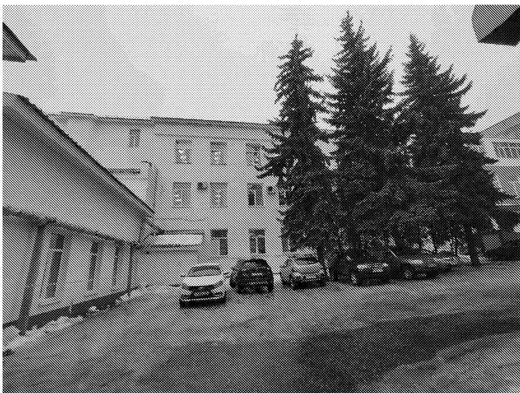
Вид на объект культурного наследия с северной стороны (09.03.2023)