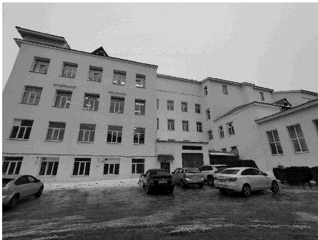
Вид на объект культурного наследия с северной стороны (09.03.2023)