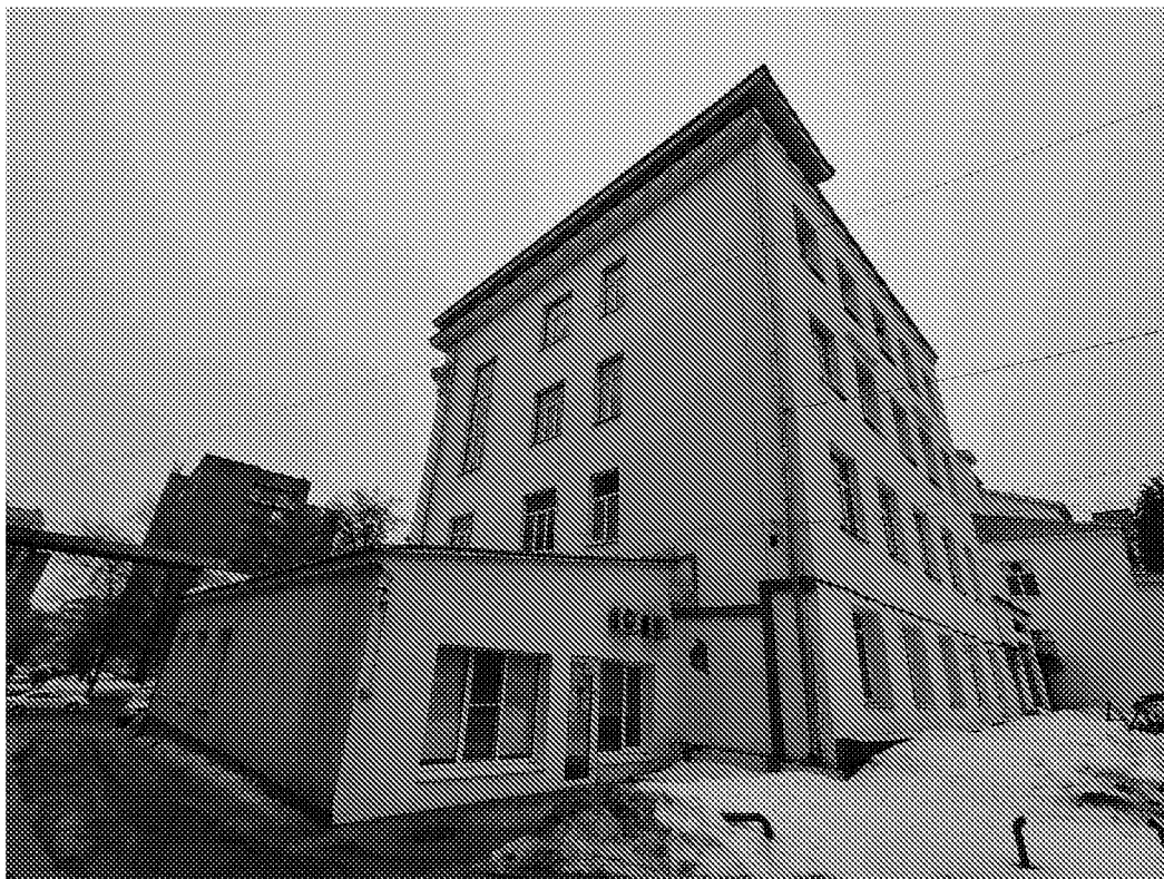
Вид на объект культурного наследия с восточной стороны (09.03.2023)