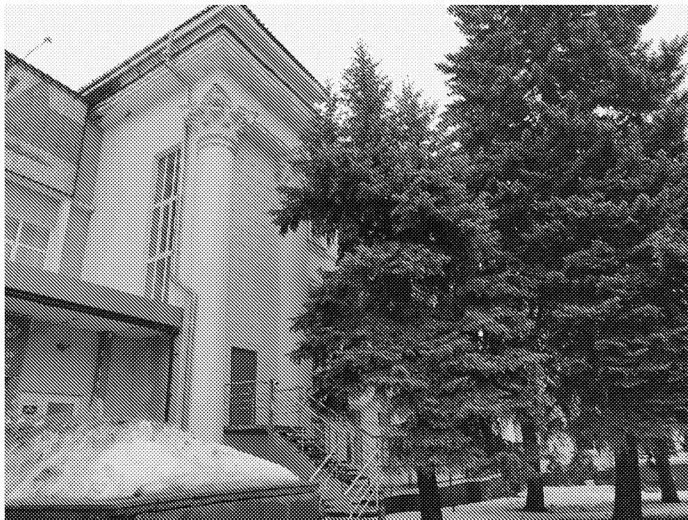
Вид на объект культурного наследия с юго-западной стороны. (09.03.2023)