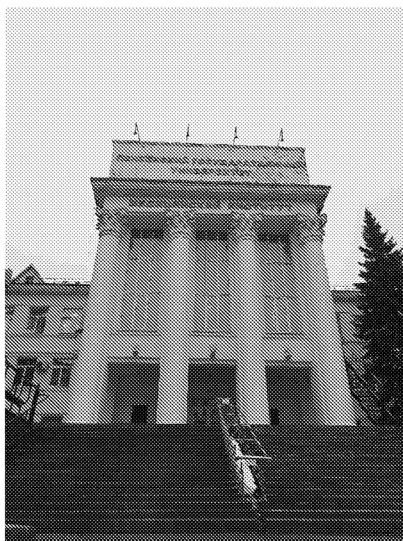
Вид на объект культурного наследия с южной стороны (09.03.2023)

Фотографическое изображение объекта культурного наследия «Бывш. здание обкома партии (ныне научно–исследовательский институт), где работали: в 1945–1948 годах секретарем обкома ВКП(б) – К.У. Черненко (впоследствии – Генеральный секретарь ЦК КПСС, Председатель Президиума Верховного Совета СССР, трижды Герой Социалистического Труда, лауреат Ленинской премии), в 1944–1947 годах заведующим сельскохозяйственным отделом обкома ВКП(б) – Ф.Д. Кулаков (впоследствии – член Политбюро ЦК КПСС, секретарь ЦК КПСС, депутат Верховного Совета 2 СССР, Герой Социалистического Труда)», расположенного по адресу: Пензенская область, г. Пенза, ул. Лермонтова, д. 3