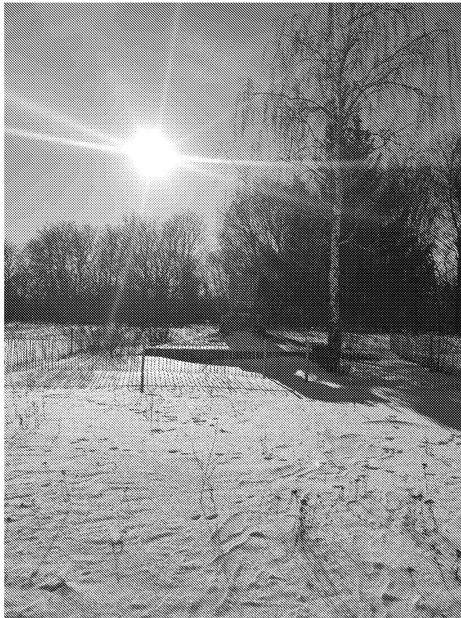
Вид на объект культурного наследия с северо-восточной стороны (25.01.2023 г.)