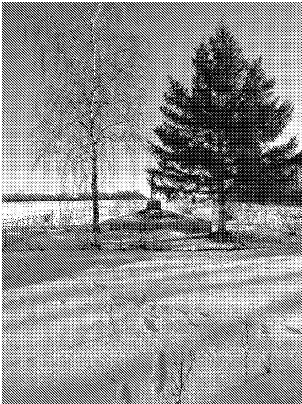
Вид на объект культурного наследия с северо-западной стороны (25.01.2023 г.)