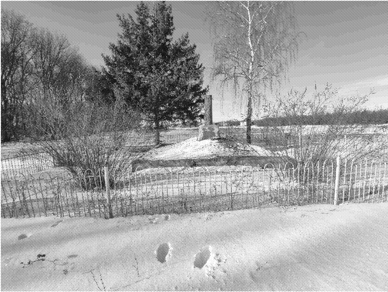
Вид на объект культурного наследия с юго-восточной стороны (25.01.2023 г.)