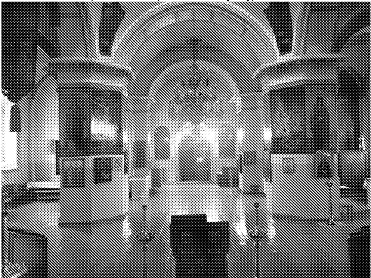
Интерьер (трапезная) объекта культурного наследия