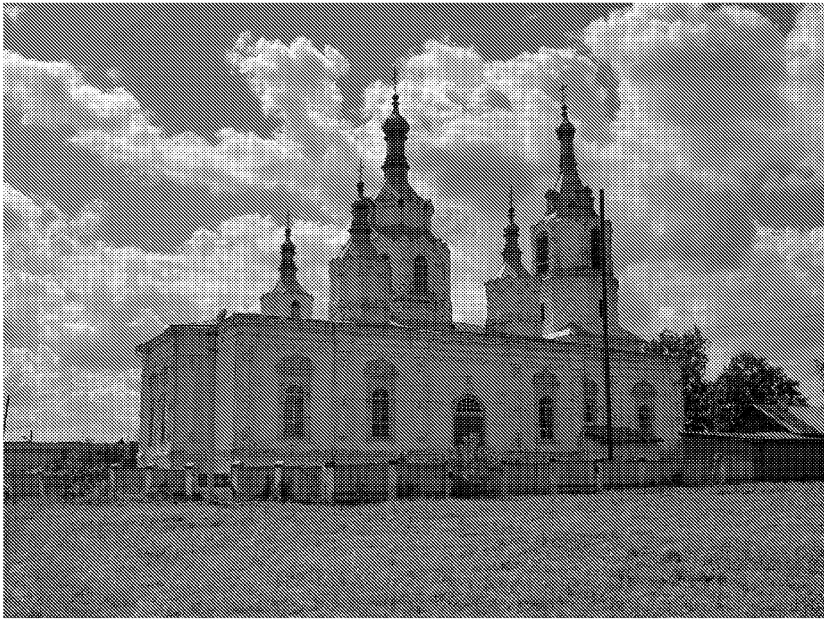
Северо-восточный фасад объекта культурного наследия