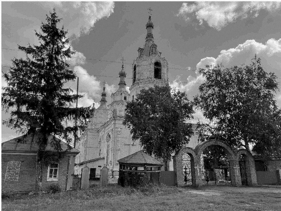
Северо-западный фасад объекта культурного наследия