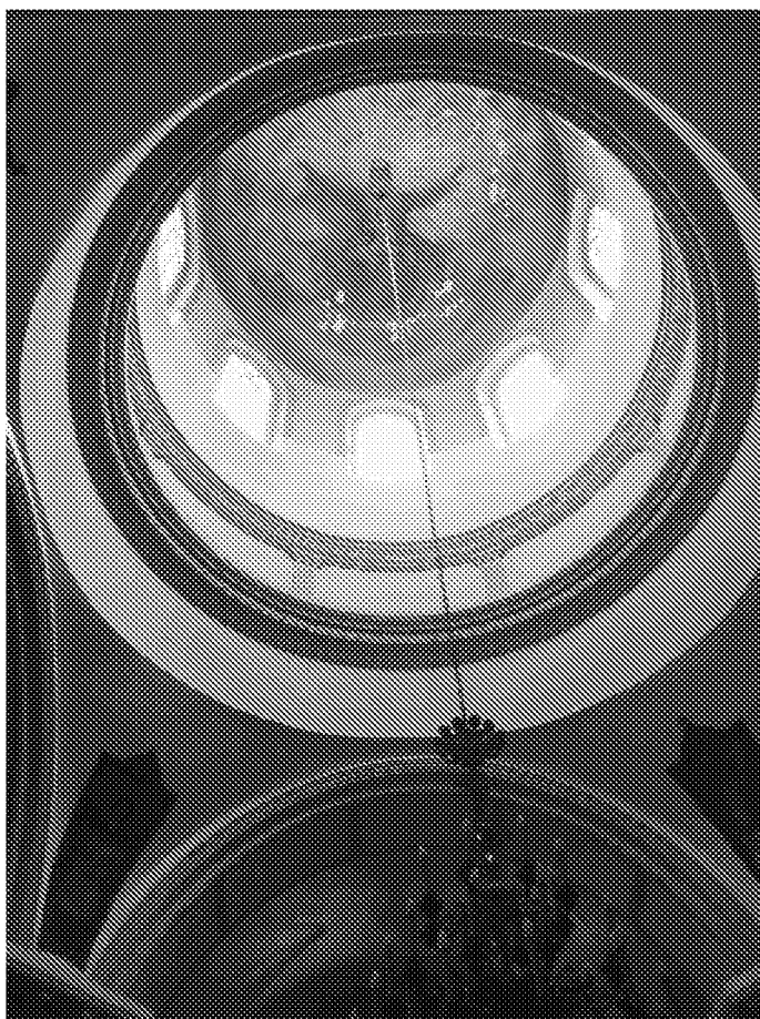
Интерьер (перекрытие наоса – световой барабан) объекта культурного наследия