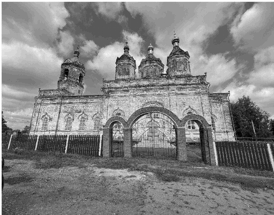
Южный фасад объекта культурного наследия