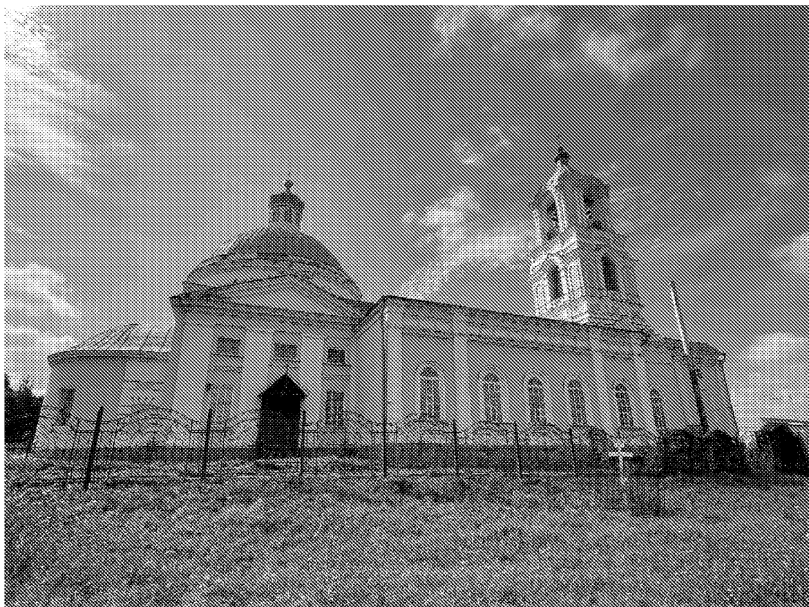
Северный фасад объекта культурного наследия