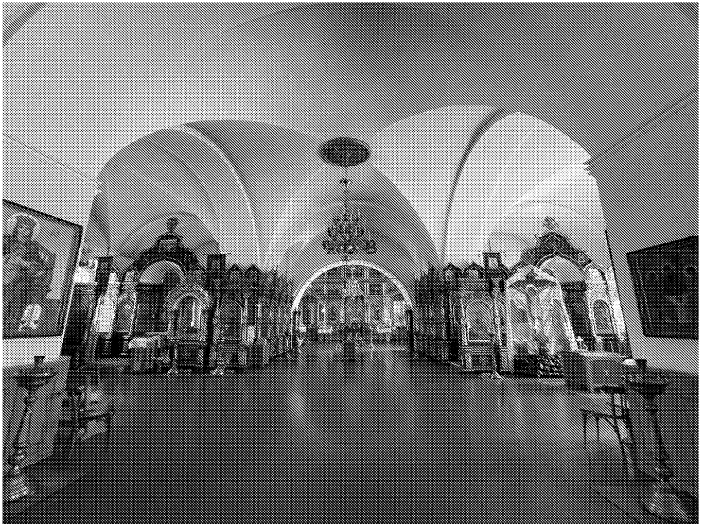
Интерьер (трапезная) объекта культурного наследия