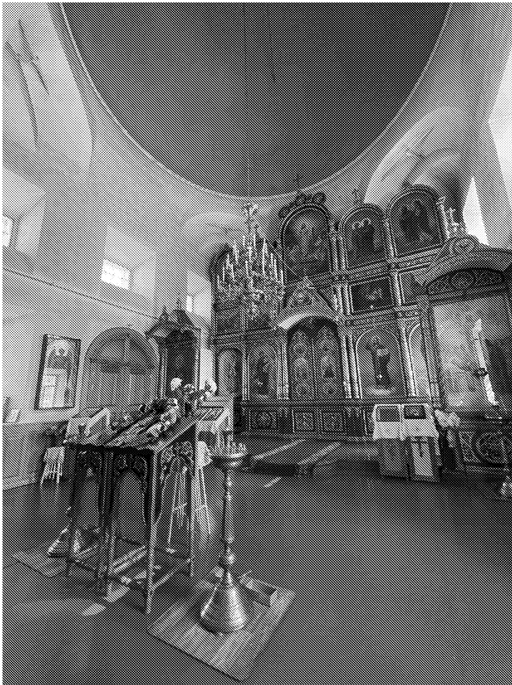
Интерьер (главный иконостас) объекта культурного наследия