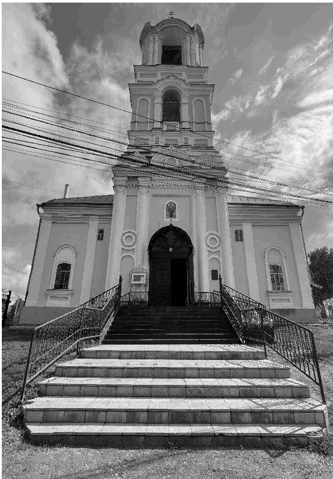
Западный фасад (колокольня) объекта культурного наследия