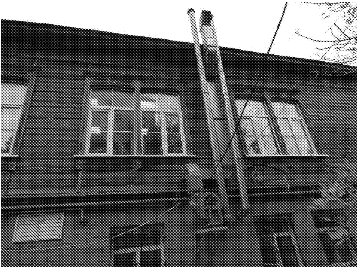
Фото 10. Северный (боковой) фасад. Оконные проемы второго этажа (форма и габариты), рисунок расстекловки.