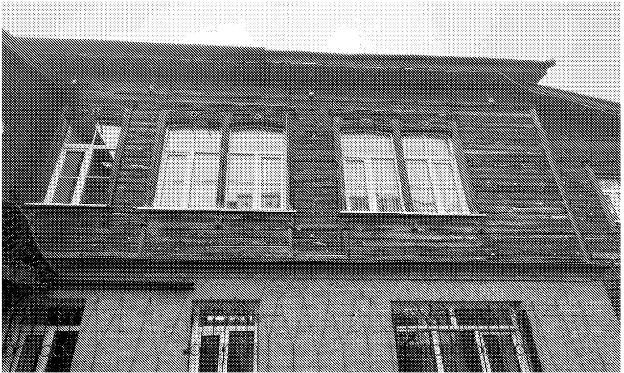
Фото 7. Южный (боковой) фасад. Оконные проемы второго этажа (форма и габариты), рисунок расстекловки.