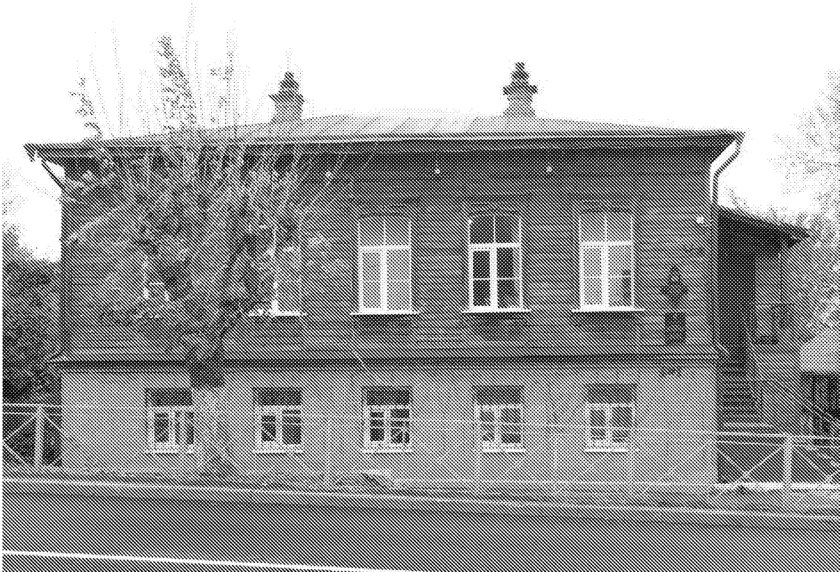
Фото 3. Западный (главный) фасад.

Количество световых осей, оконные проемы второго этажа (форма и габариты).