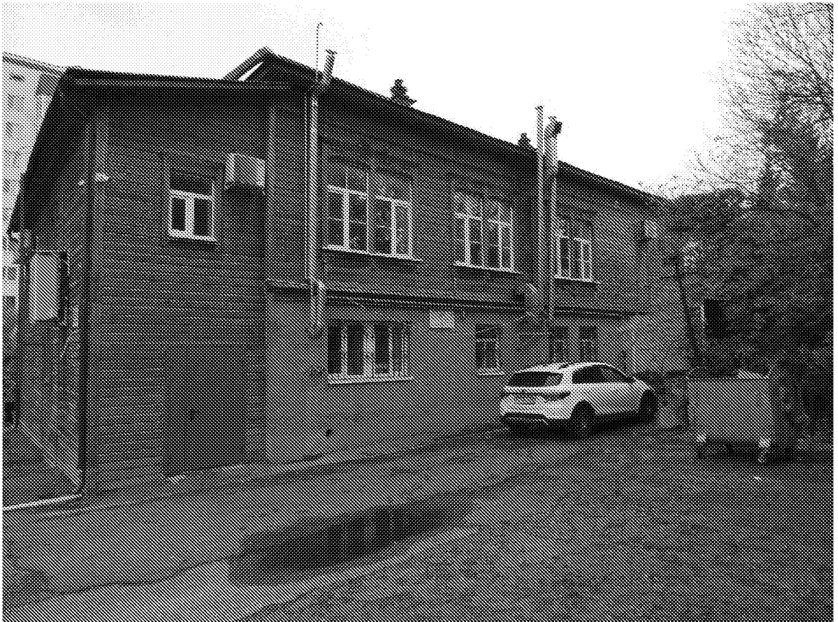
Фото 8. Северный (боковой) фасад. Количество световых осей, оконные проемы второго этажа (форма и габариты).