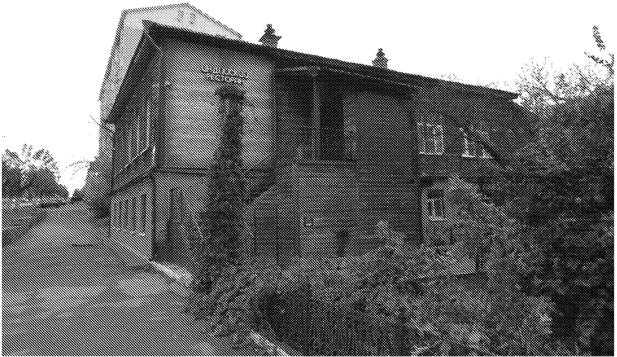
Фото 5. Южный (боковой) фасад. Количество световых осей, оконные проемы второго этажа (форма и габариты).