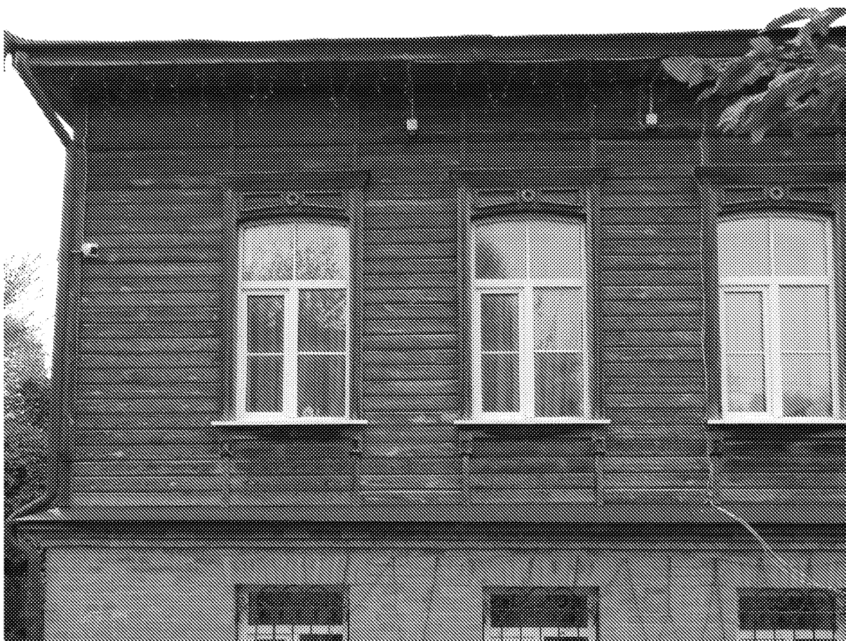
Фото 4. Западный (главный) фасад.

Количество световых осей, оконные проемы второго этажа (форма и габариты).