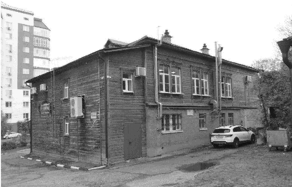
Фото 2. Объемно пространственная композиция здания. Вид дворовой территории с северо-восточного направления.