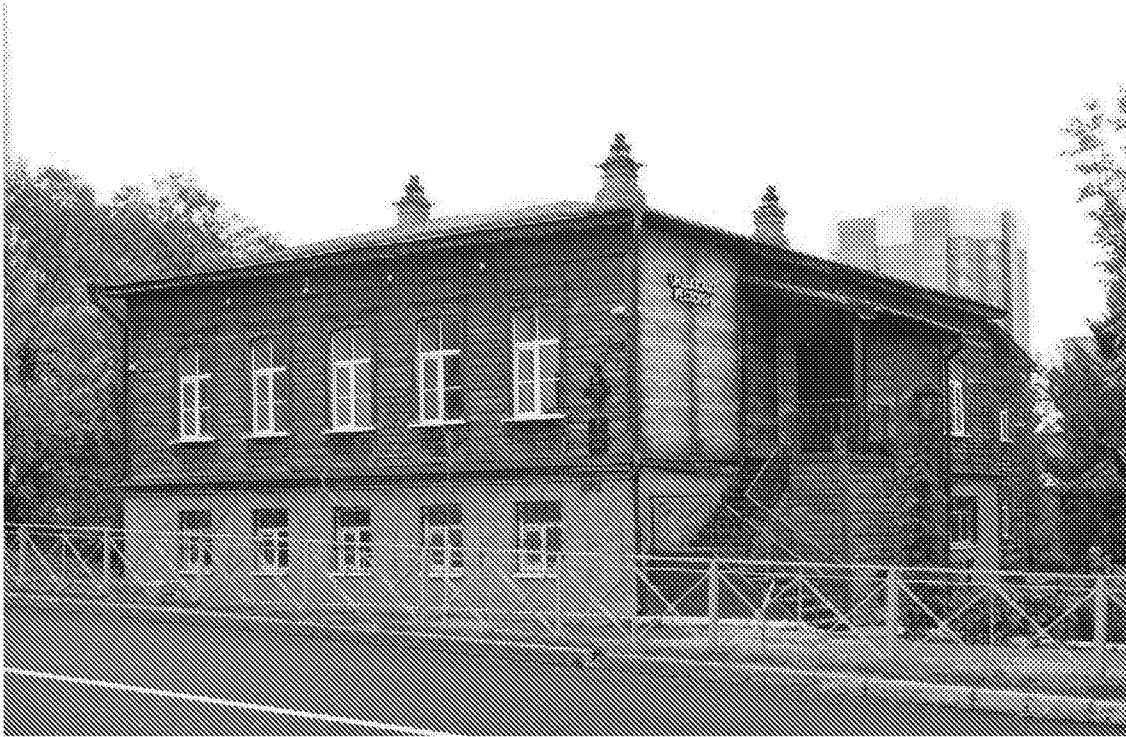
Фото 1. Объемно пространственная композиция здания. Вид с ул. Куйбышева с юго-западного направления.