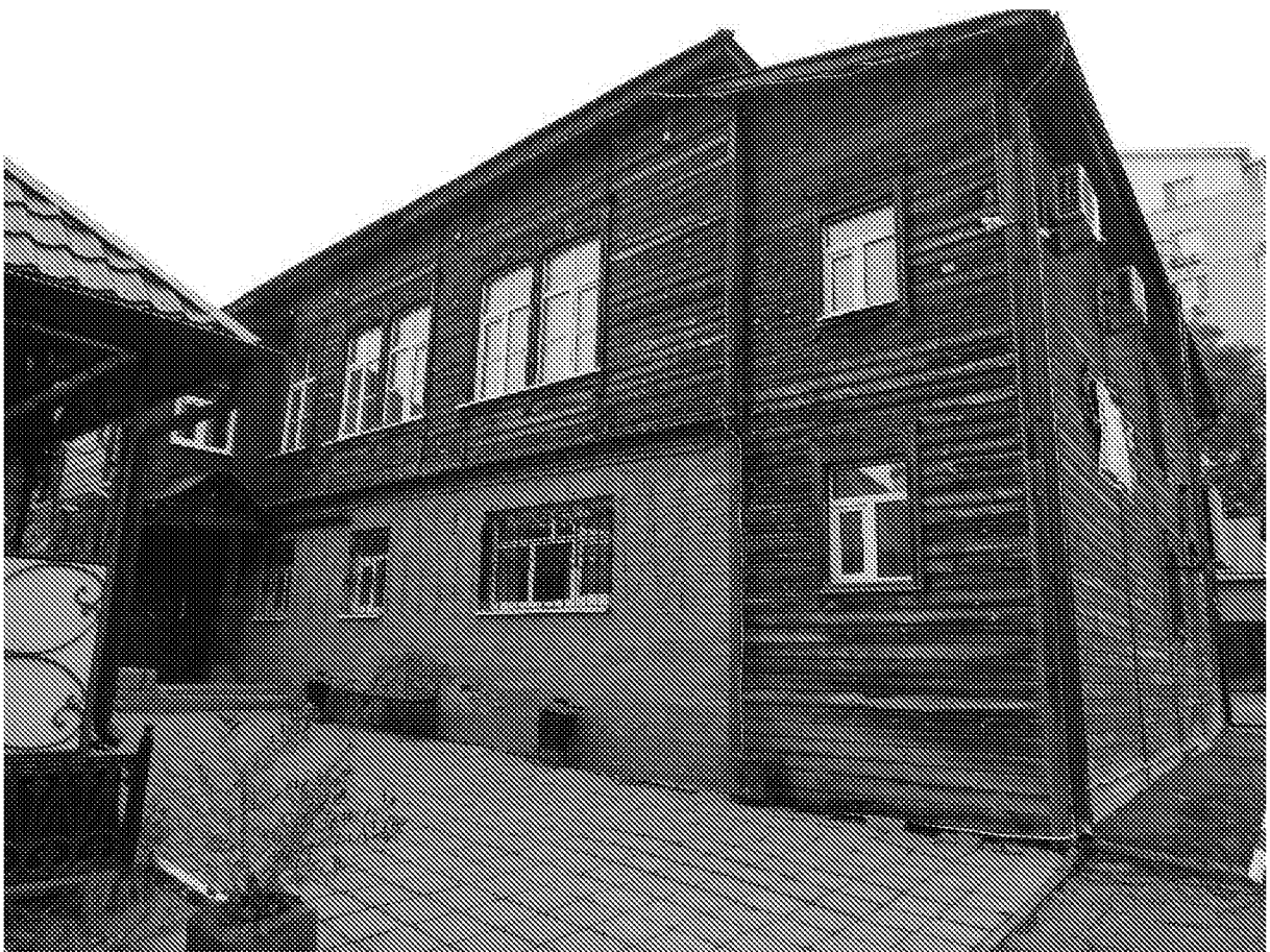
Фото 6. Южный (боковой) фасад. Количество световых осей, оконные проемы второго этажа (форма и габариты).