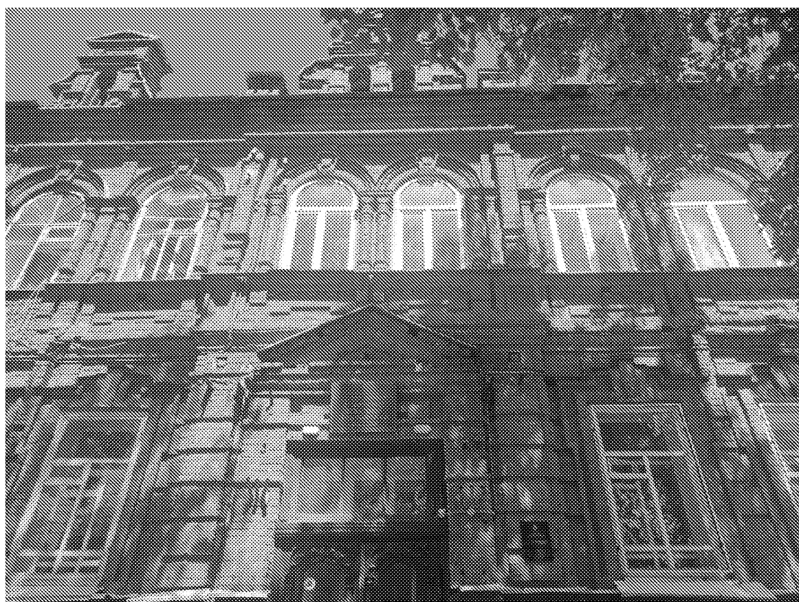
Декоративные элементы главного фасада объекта культурного наследия