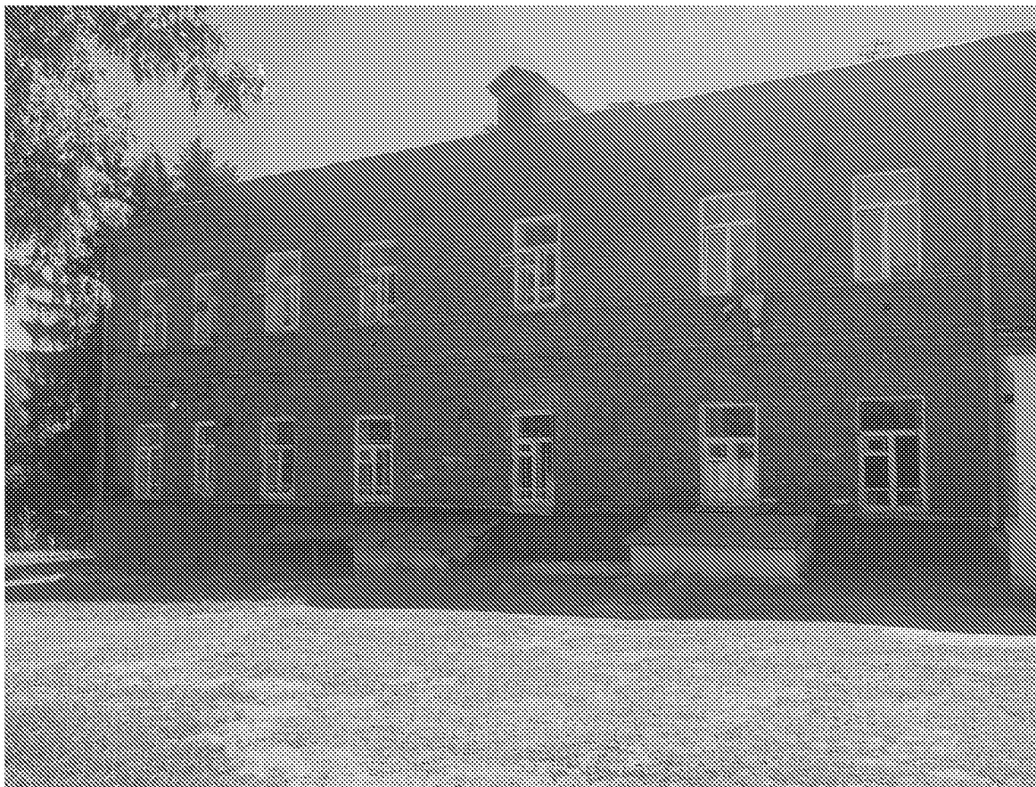
Фрагмент дворового (северного) фасада объекта культурного наследия