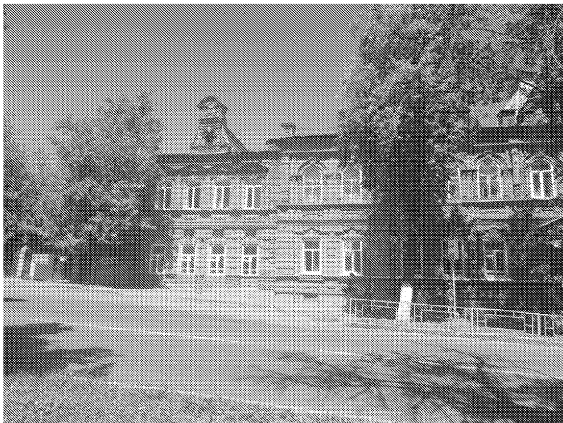
Главный (южный) фасад объекта культурного наследия со стороны ул. Лермонтова