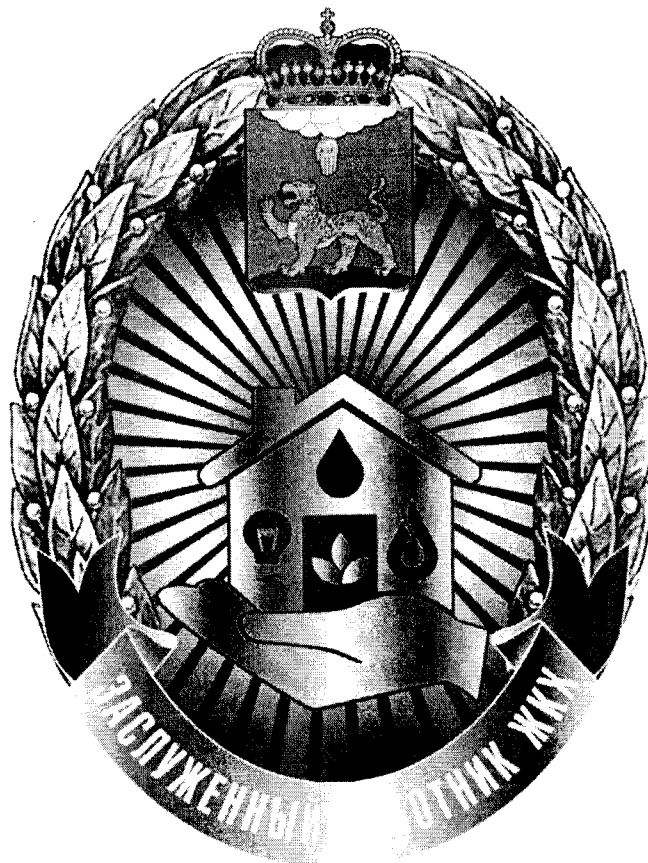
РИСУНОК нагрудного знака «Заслуженный работник жилищно-коммунального хозяйства Псковской области»