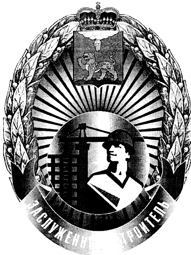
РИСУНОК нагрудного знака «Заслуженный строитель Псковской области»