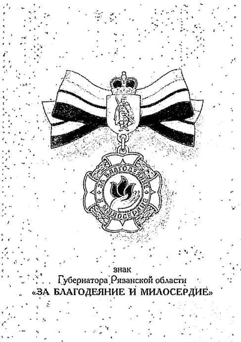
знак Губернатора Рязанской области «ЗА БЛАГОДЕЯНИЕ И МИЛОСЕРДИЕ»