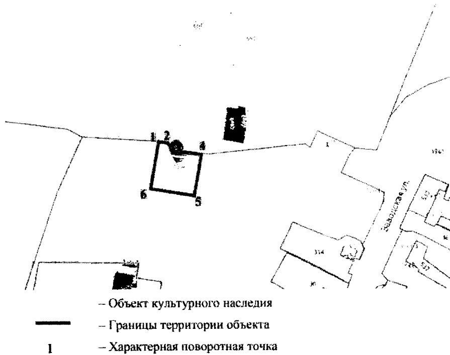
Схема границ территории объекта культурного наследия