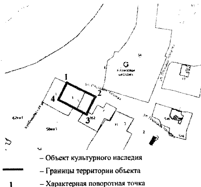
Схема границ территории объекта культурного наследия