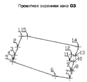
Проектная охрannая зона ОЗ