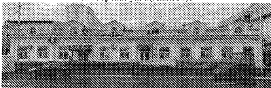
Главный фасад здания со стороны ул. Кутякова, 9

- декоративное оформление фасада здания, выполненное в стиле эклектика;