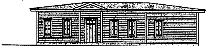
ГЛАВНЫЙ ФАСАД (СЕВЕРО-ВОСТОЧНАЯ ОРИЕНТАЦИЯ)