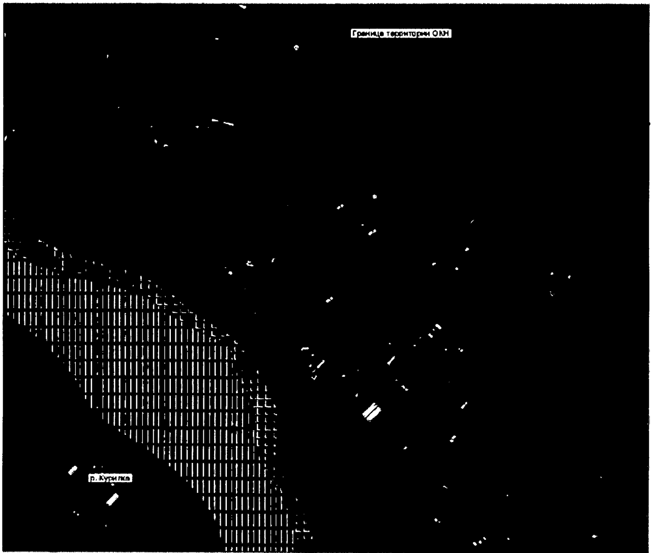
Схема предмета охраны объекта культурного наследия регионального значения (достопримечательное место) «Место основания в 1778 году русского поселения», расположенного по адресу: Сахалинская область, муниципальное образование «Курильский городской округ», о. Итуруп, г. Курильск