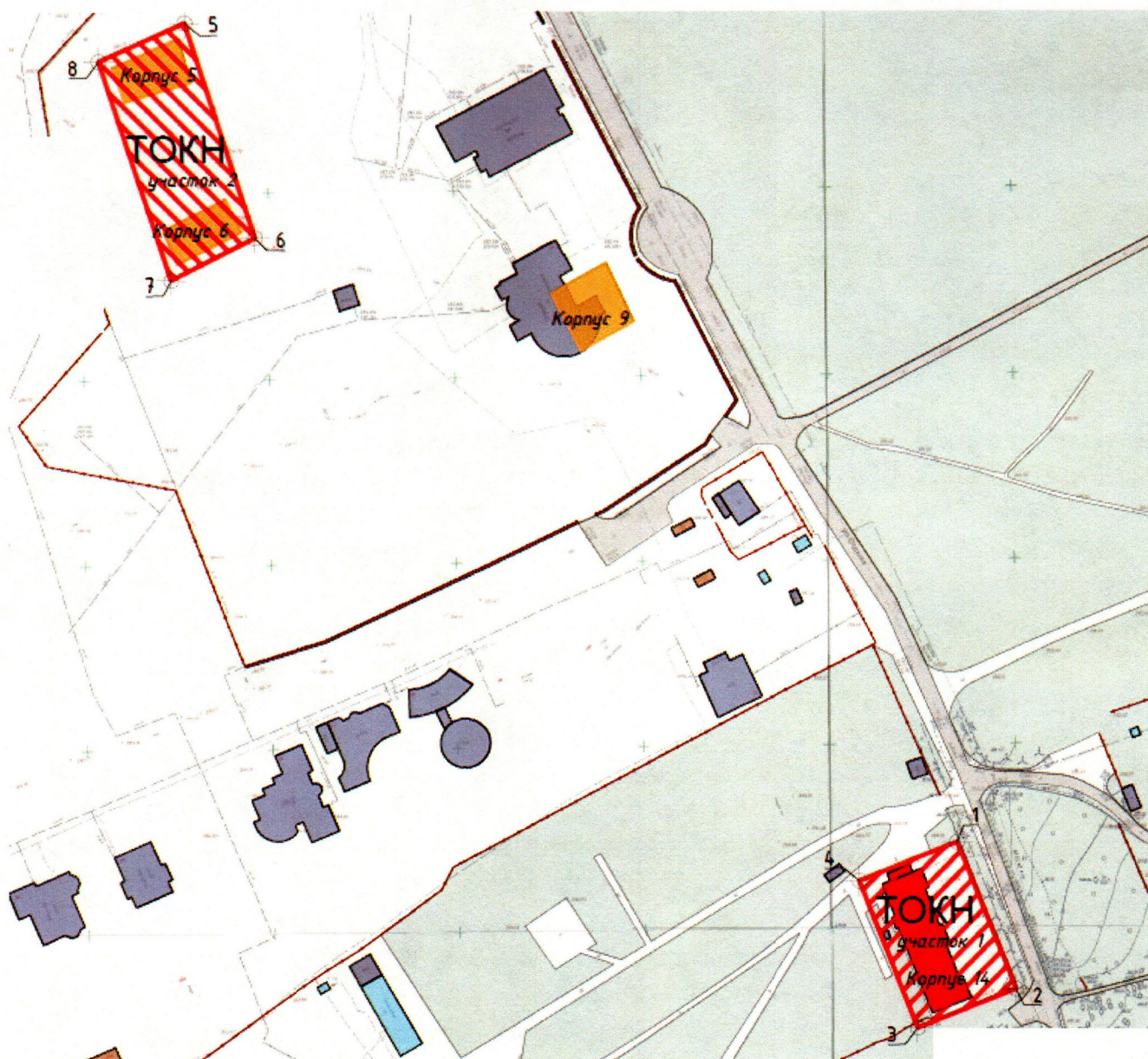
Условные обозначения к карте (схеме) границ территории Объектов