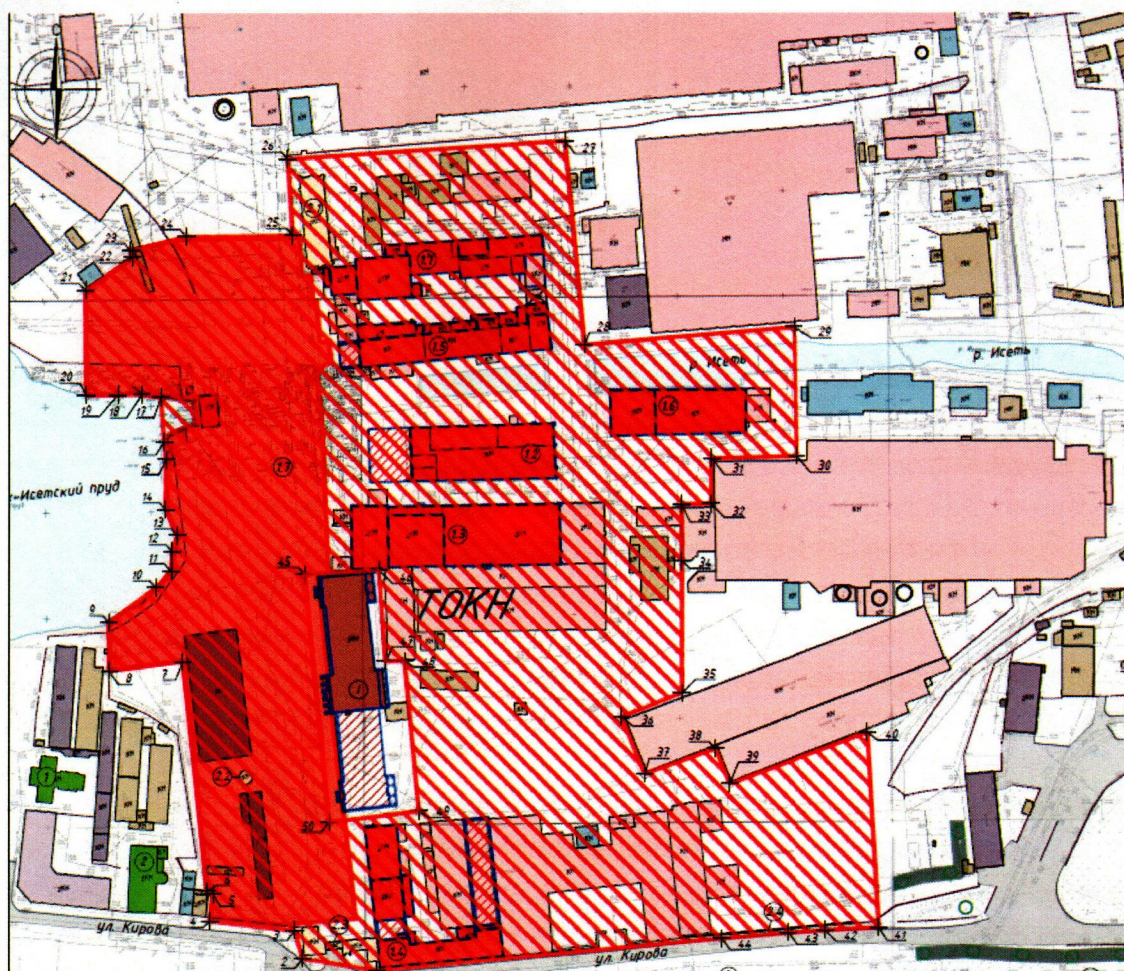
Условные обозначения к карте (схеме) границ территории Объектов