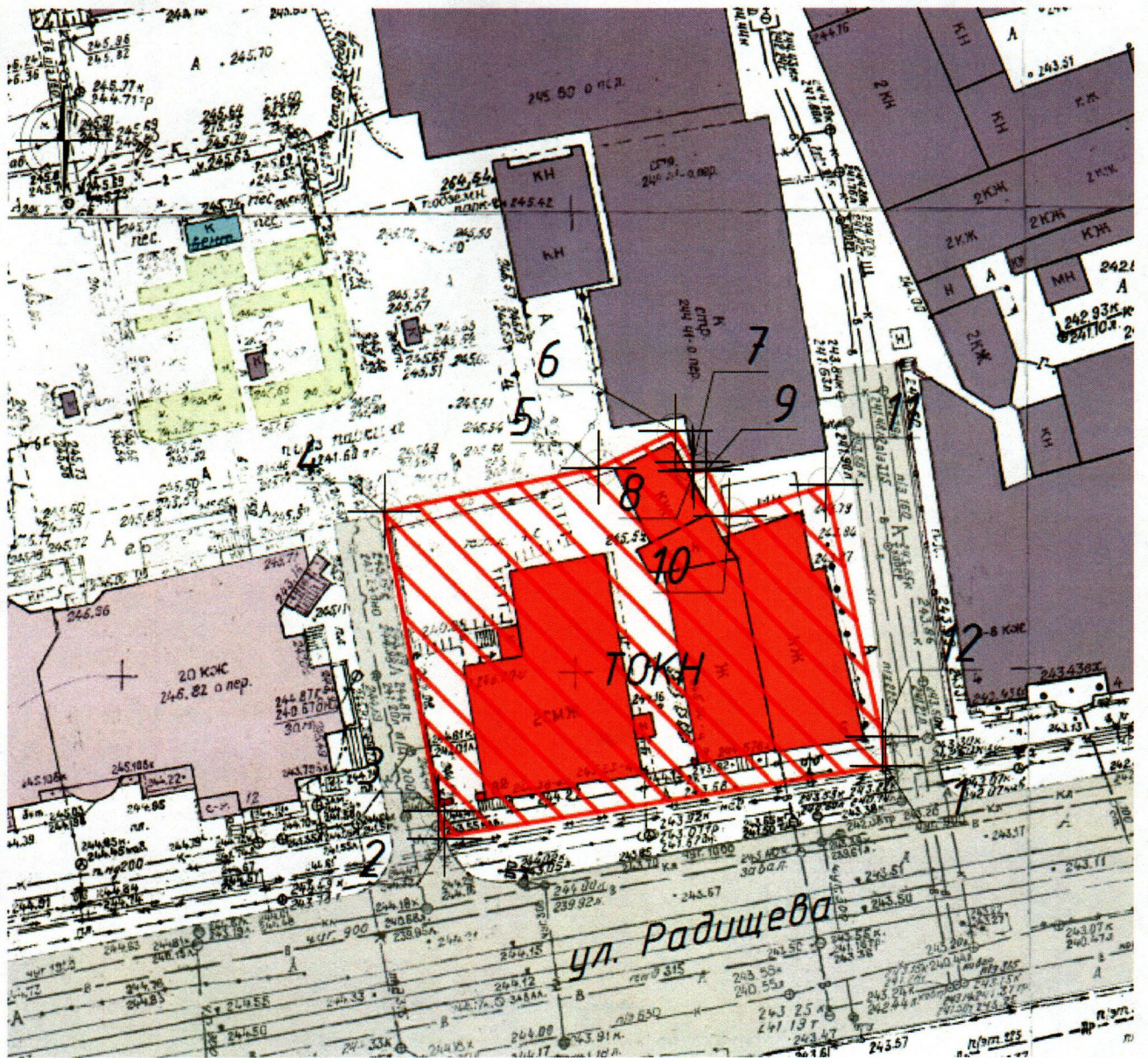
Условные обозначения к карте (схеме) границ территории Объектов