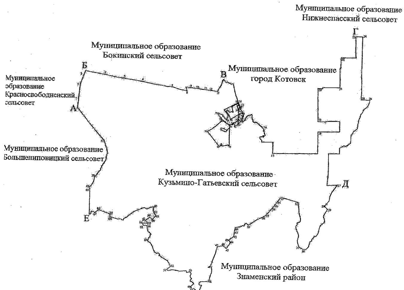
СХЕМА ГРАНИЦ МУНИЦИПАЛЬНОГО ОБРАЗОВАНИЯ - КУЗЬМИНО-ГАТЬЕВСКИЙ СЕЛЬСОВЕТ ТАМБОВСКОГО РАЙОНА ТАМБОВСКОЙ ОБЛАСТИ

«Приложение № 223 к Закону Тамбовской области «Об установлении границ и определении места нахождения представительных органов муниципальных образований Тамбовской области»