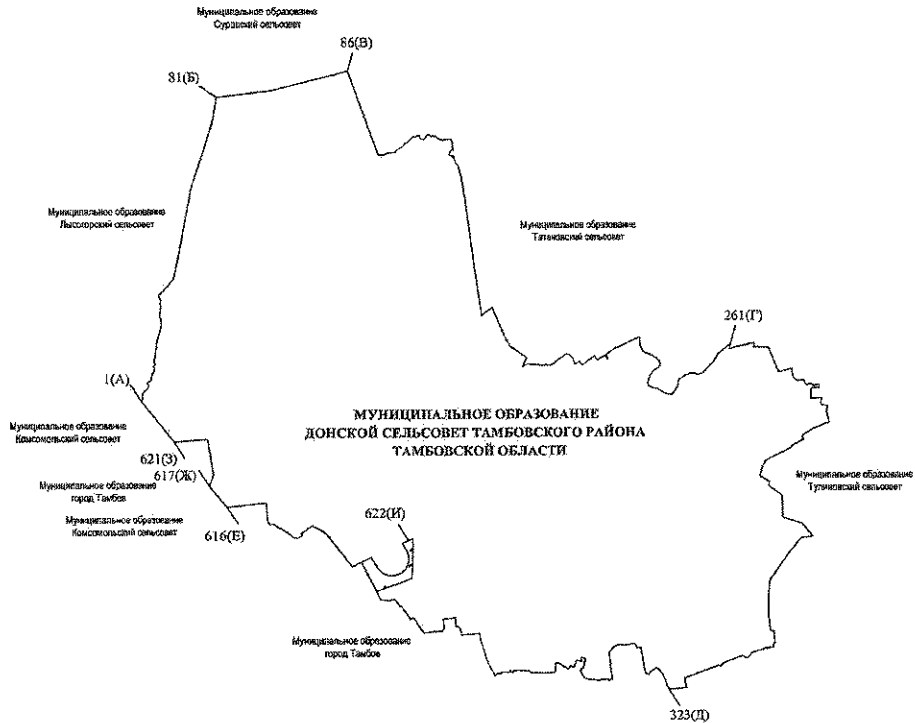
СХЕМА ГРАНИЦ МУНИЦИПАЛЬНОГО ОБРАЗОВАНИЯ – ДОНСКОЙ СЕЛЬСОВЕТ ТАМБОВСКОГО РАЙОНА ТАМБОВСКОЙ ОБЛАСТИ