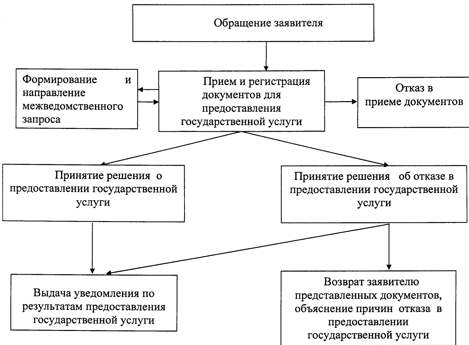
Блок-схема порядка предоставления государственной услуги

к административному регламенту предоставления государственной услуги «предоставление пособия на ребенка» (с изменением от 29 декабря 2017 г.)