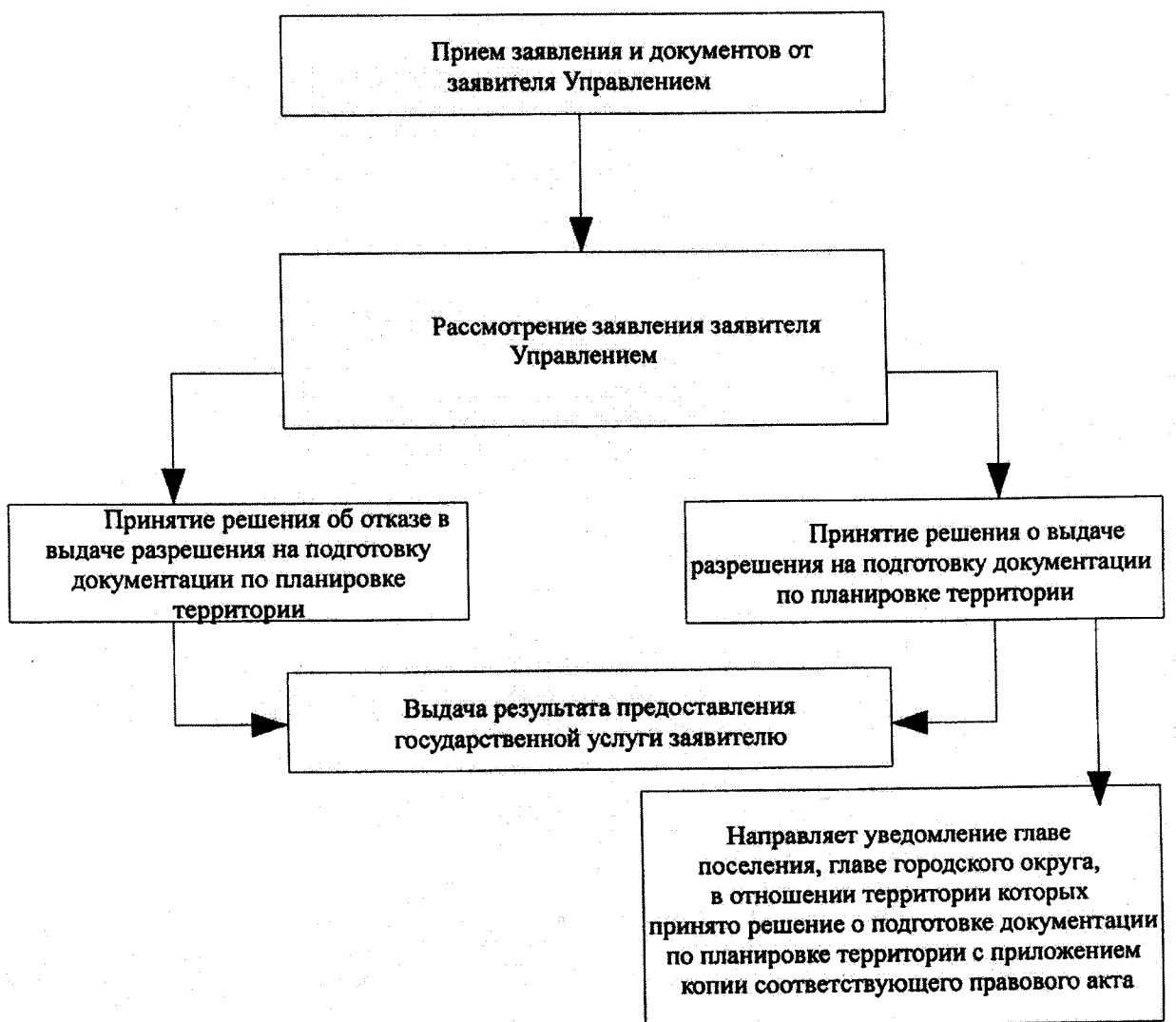
Блок-схема процедур предоставления государственной услуги

к административному регламенту предоставления государственной услуги «принятие решения о подготовке документации по планировке территории, предусматривающей размещение объектов регионального значения и иных объектов капитального строительства, размещение которых планируется на территории двух и более муниципальных образований (муниципальных районов, городских округов) в границах Тамбовской области»