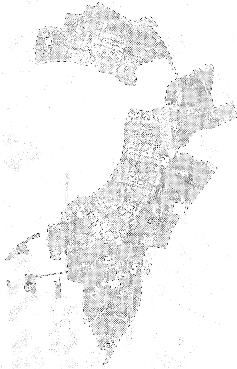
Карта границ населенных пунктов, входящих в состав городского поселения города Калязина Калязинского муниципального района Тверской области