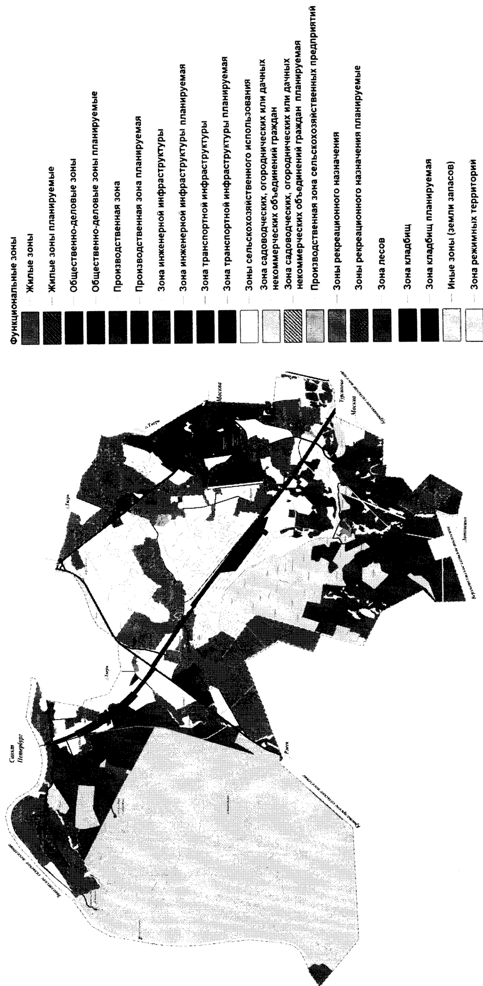
Карта функциональных зон Никулинского сельского поселения Калининского муниципального района Тверской области