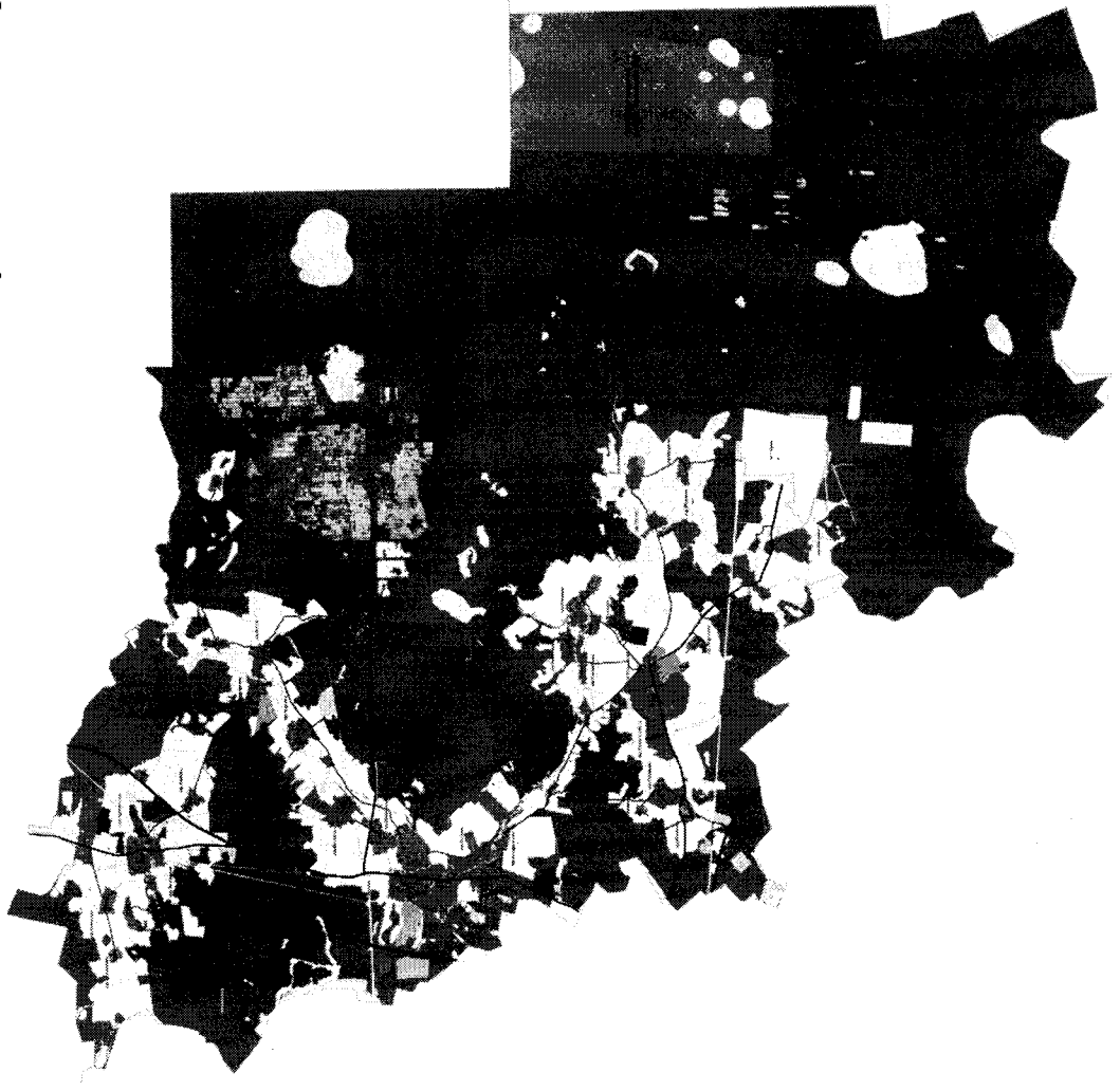
Рисунок 1. Карта планируемого размещения объектов местного значения.

Карта планируемого размещения объектов местного значения Славновского сельского поселения Калининского муниципального района Тверской области