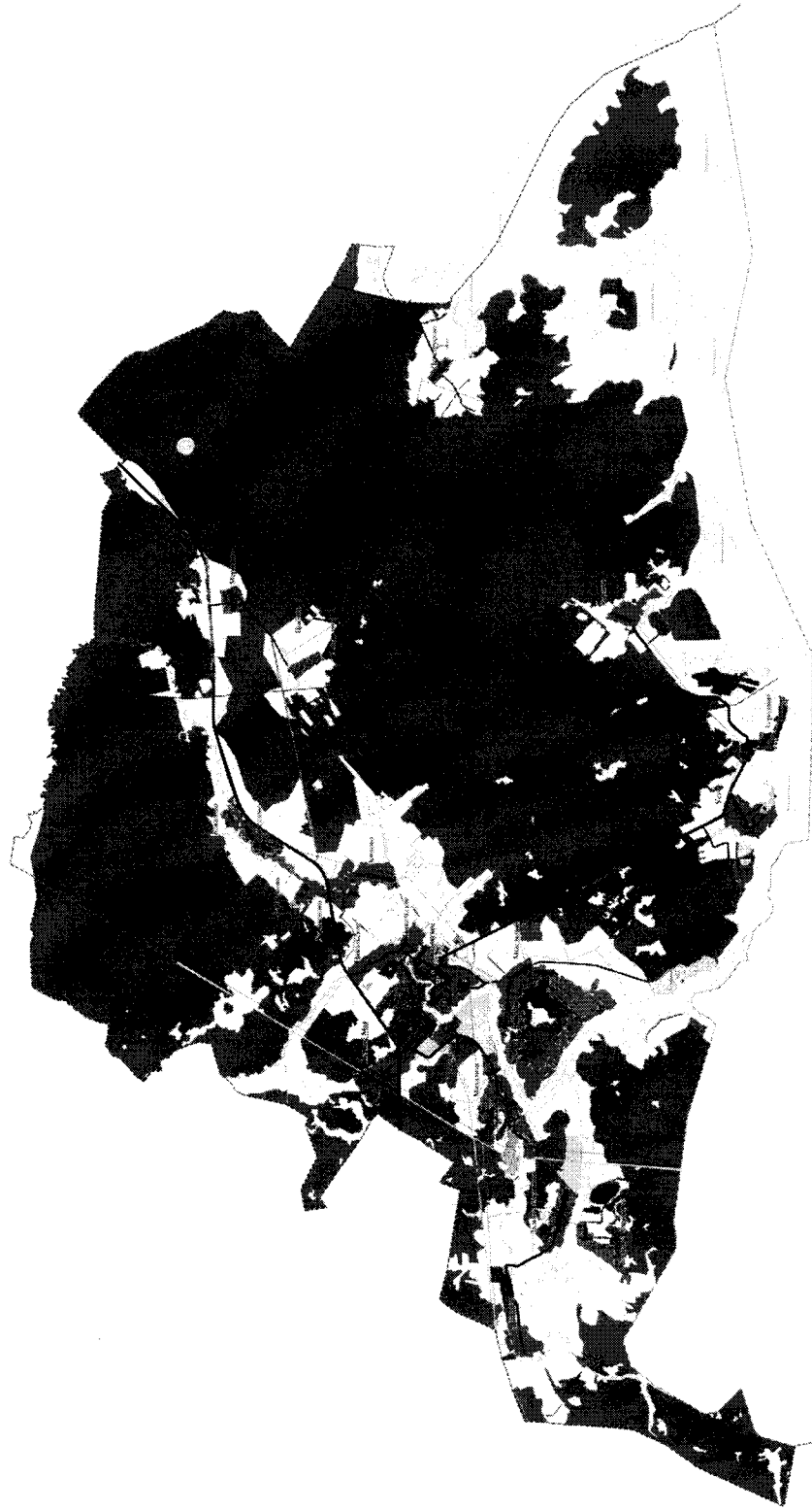
Рисунок 1. Карта планируемого размещения объектов местного значения.

Карта планируемого размещения объектов местного значения Первомайского сельского поселения Конаковского муниципального района Тверской области