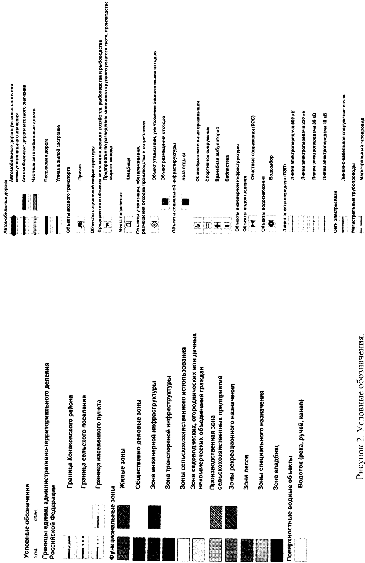
Рисунок 2. Условные обозначения.