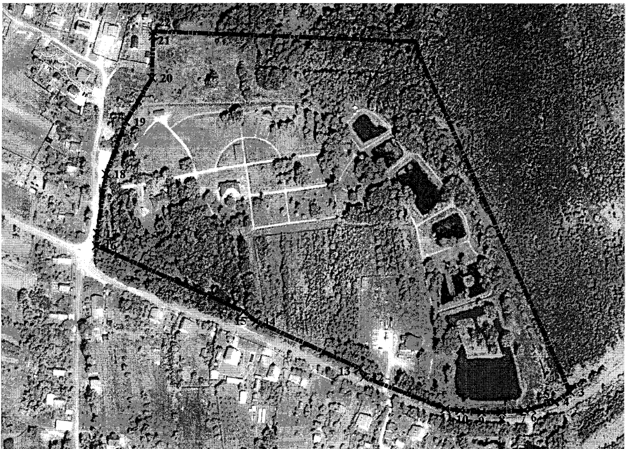
Схема границ территории объекта культурного наследия регионального значения «Ансамбль усадьбы В.Д. Держица Домотканово» и объектов, входящих в его состав, по адресу: Тверская область, Калининский район, деревня Красная Новь

----- - Граница территории объекта культурного наследия