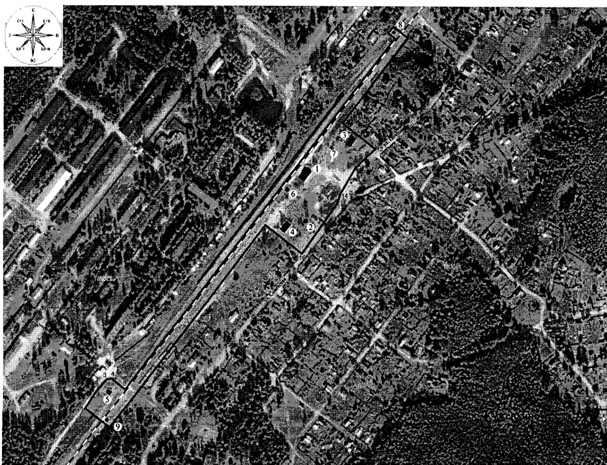
Схема границ территории объекта культурного наследия регионального значения «Ансамбль зданий и сооружений железнодорожной станции Куженкино Бологое - Полоцкой (Октябрьской) железной дороги, 1902-1907 гг.» и объектов, входящих в его состав, расположенного по адресу: Тверская область, Бологовский район, поселок городского типа Куженкино, без номера строений