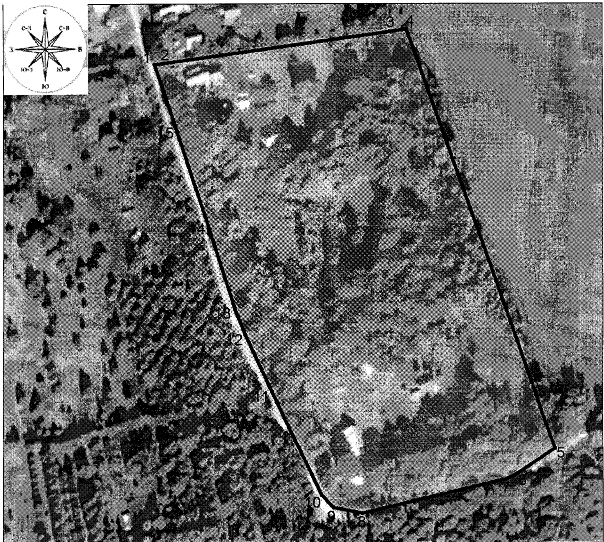
Схема границ территории объекта культурного наследия регионального значения «Парк усадьбы Рябинки, XVIII - нач. XX вв.», расположенного по адресу: Тверская область, Конаковский район, Вахонинское сельское поселение, деревня Рябинки