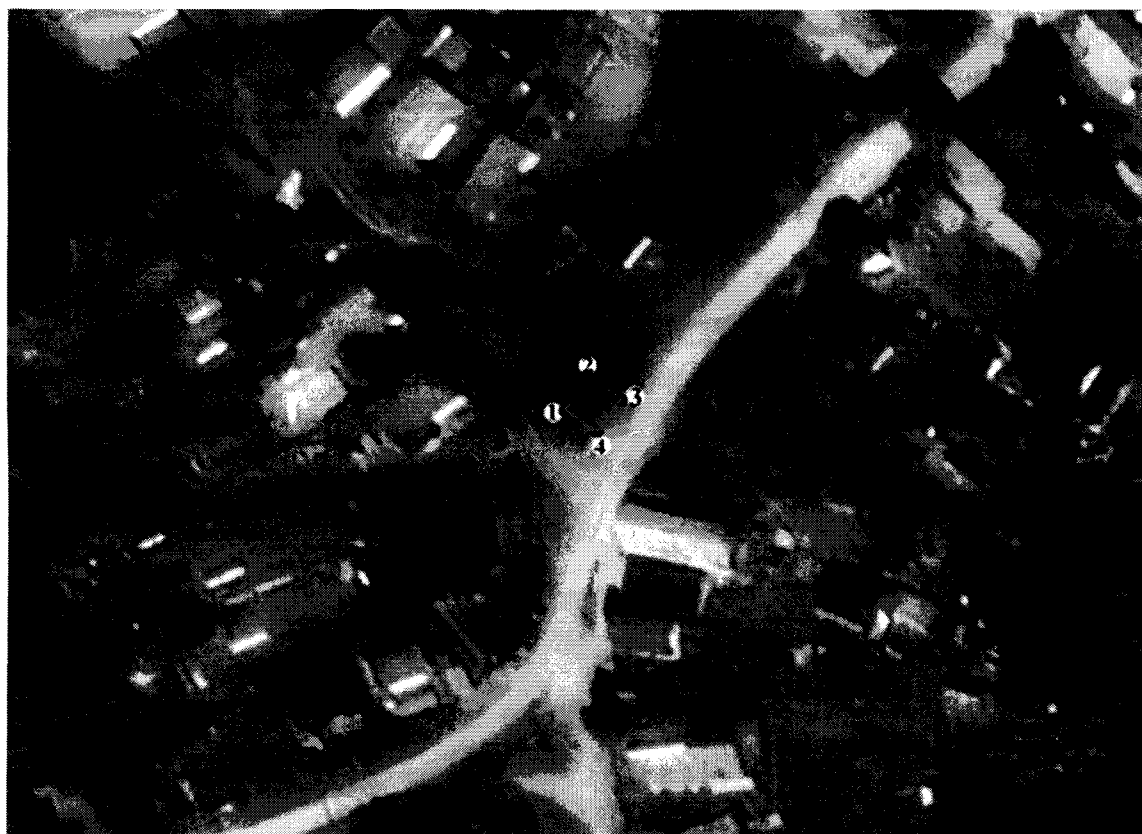
Схема границ территории объекта культурного наследия регионального значения «Братская могила», 1941 – 1945 гг., расположенного по адресу: Тверская область, Осташковский городской округ, д. Жар