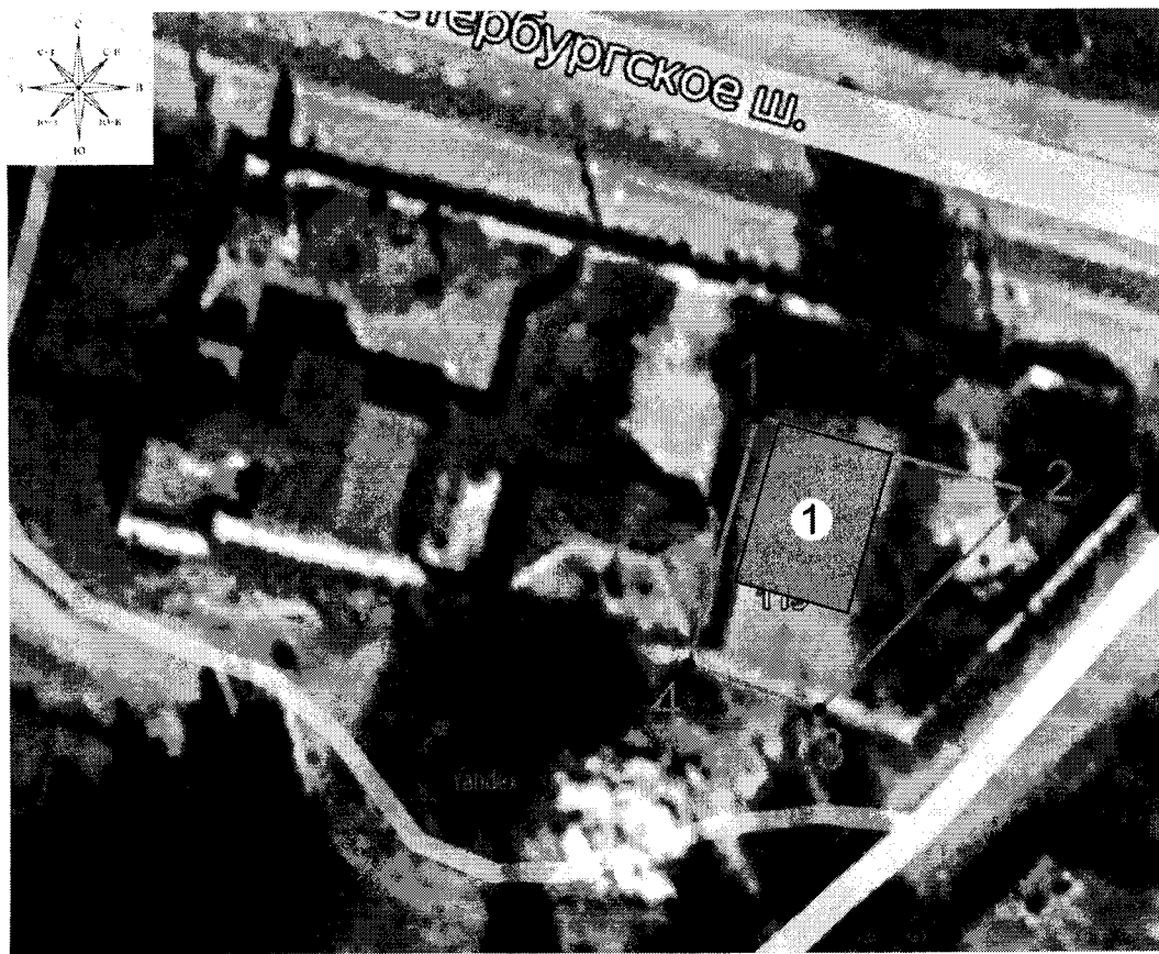
Схема границ территории объекта культурного наследия регионального значения «Часовня с кельей Николо-Малицкого монастыря», 2-я пол. XIX в., расположенного по адресу: Тверская область, г. Тверь, ш. Петербургское, д. 119