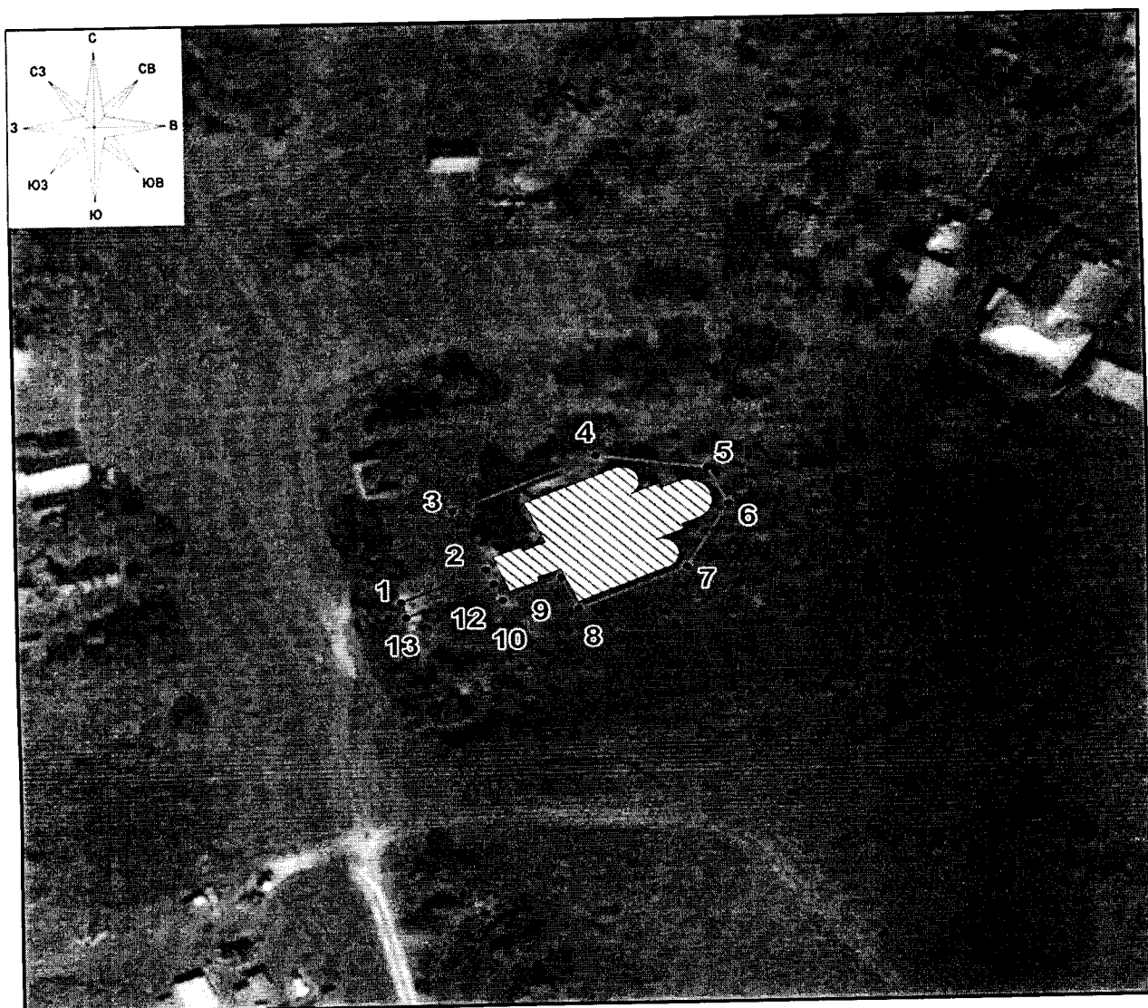
Схема границ территории объекта культурного наследия федерального «Никитская церковь с иконостасом», 1803 г., XIX в., расположенного по адресу: Тверская область, Бежецкий район, село Лозьево