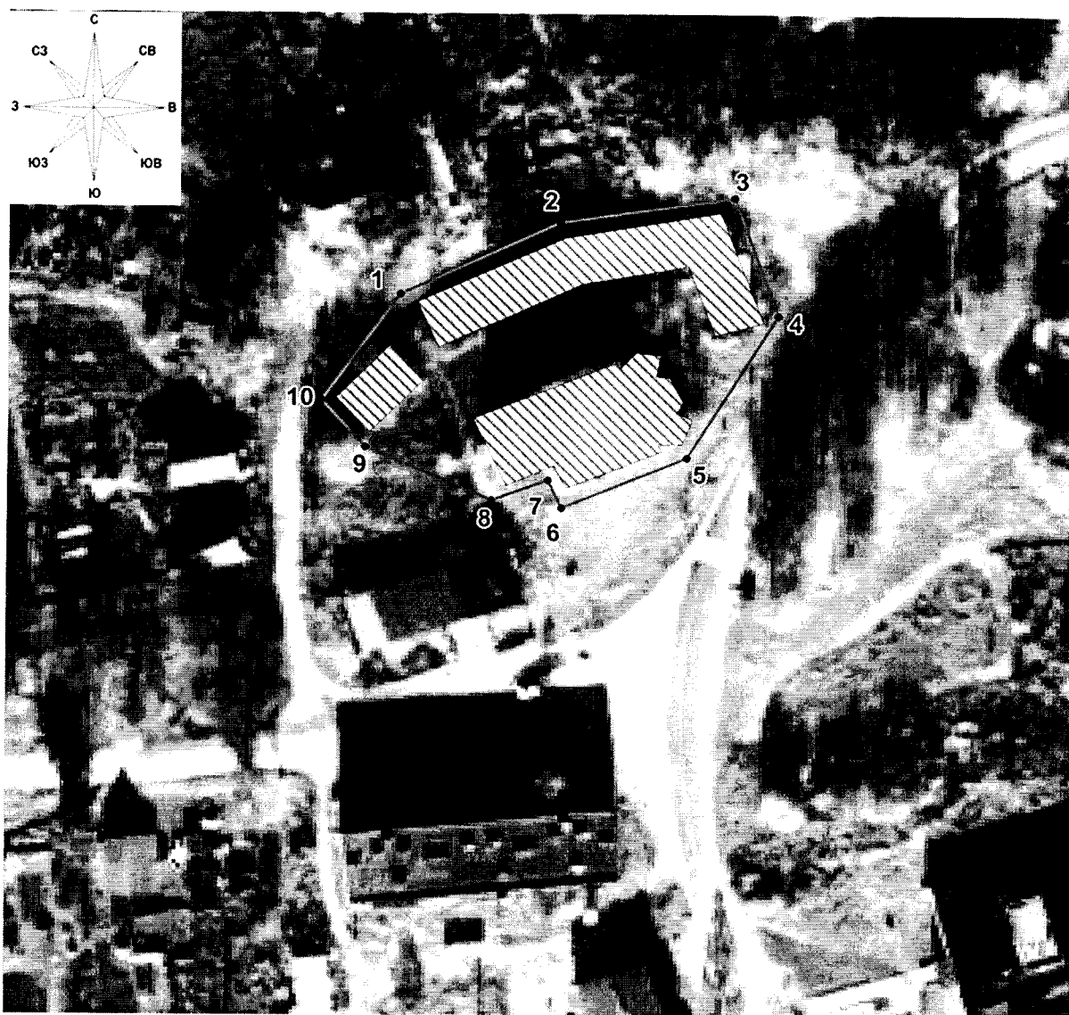
Схема границ территории объекта культурного наследия федерального значения «Преображенская церковь с жилой застройкой центральной площади», 1785 г., расположенного по адресу: Тверская область, Вышневолоцкий городской округ, село Есеновичи