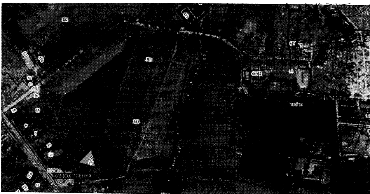
Схема границ защитной зоны объекта культурного наследия федерального значения «Усадьба», XVIII – XIX вв., расположенного по адресу: Тверская область, Вышневолоцкий городской округ, д. Афимьино