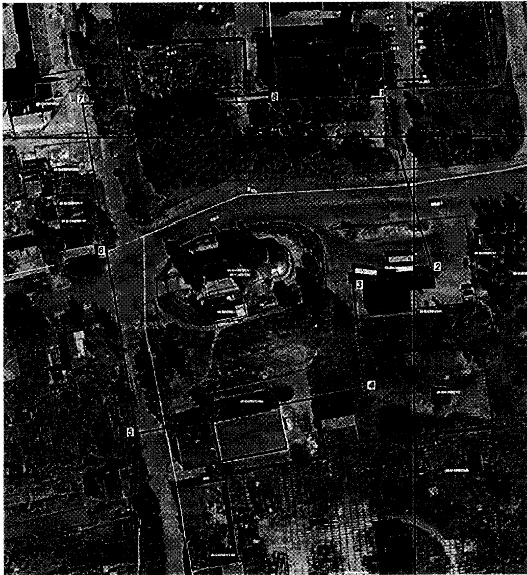
Схема границ защитной зоны объекта культурного наследия федерального значения «Ансамбль церкви Ильи Пророка», 1782 – 1804 гг., расположенного по адресу: Тверская область, Старицкий район г. Старица, ул. Володарского, д. 46