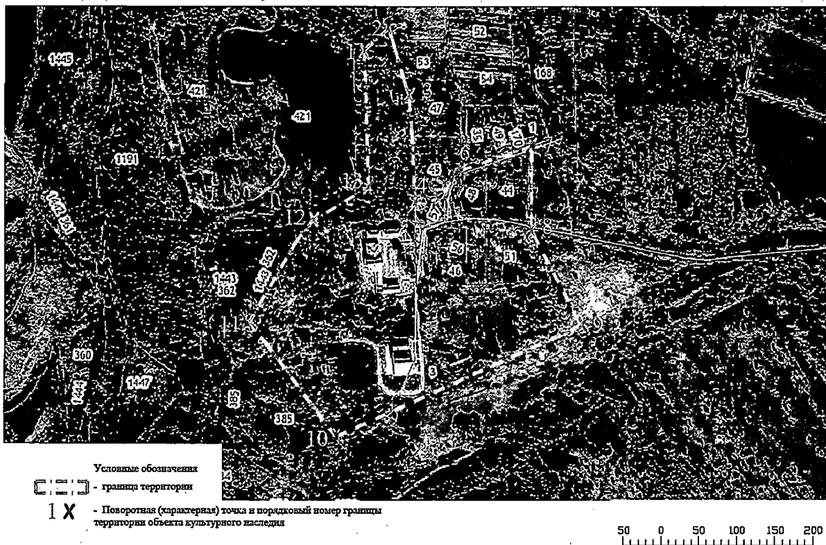
Схема границ территории объекта культурного наследия регионального значения «Усадебный комплекс Лажечниковых (позднее Мариинский монастырь)», XIX в., расположенного по адресу: Тверская область, Старицкий муниципальный округ, с. Коноплино