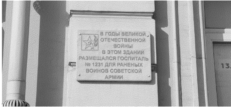
Фото № 8. Мемориальная доска, расположенная на главном фасаде со стороны проспекта Ленина