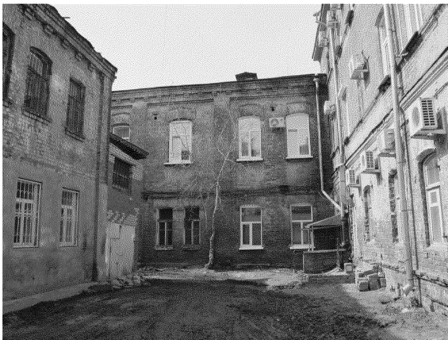
Фото № 12. Вид на дворовой фасад