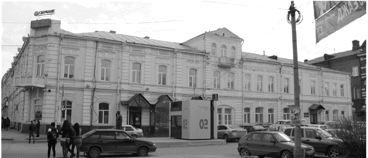
Фото № 2. Вид на главный фасад со стороны переуллка Нахановича