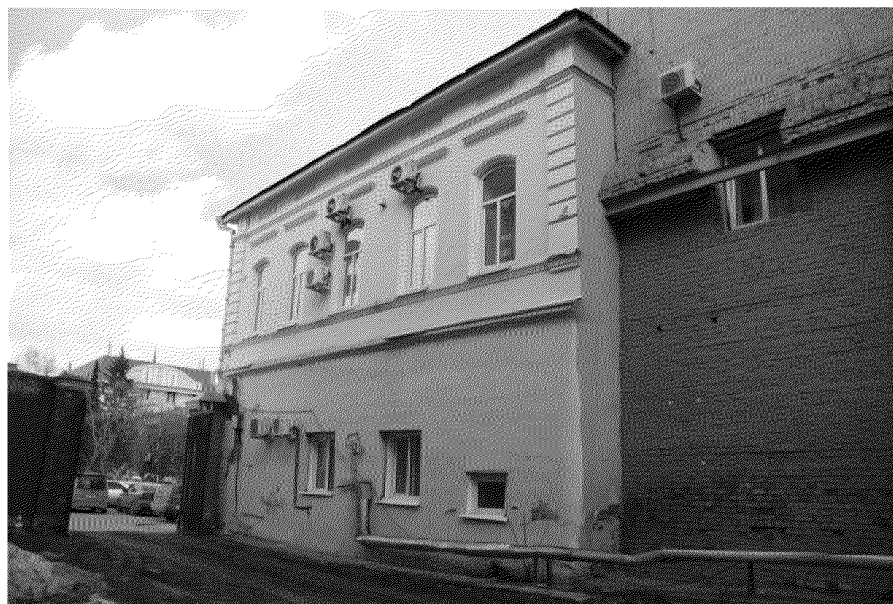
Фото № 9. Вид на западный фасад со стороны здания по переулку Нахановича, 3