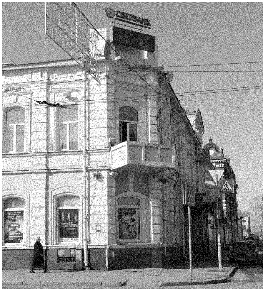
Фото № 4. Вид на угол здания на пересечении проспекта Ленина и переулка Нахановича