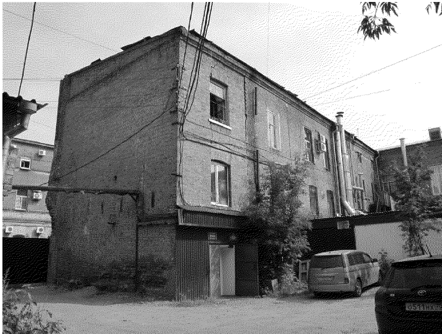
Фото № 11. Вид на дворовой фасад