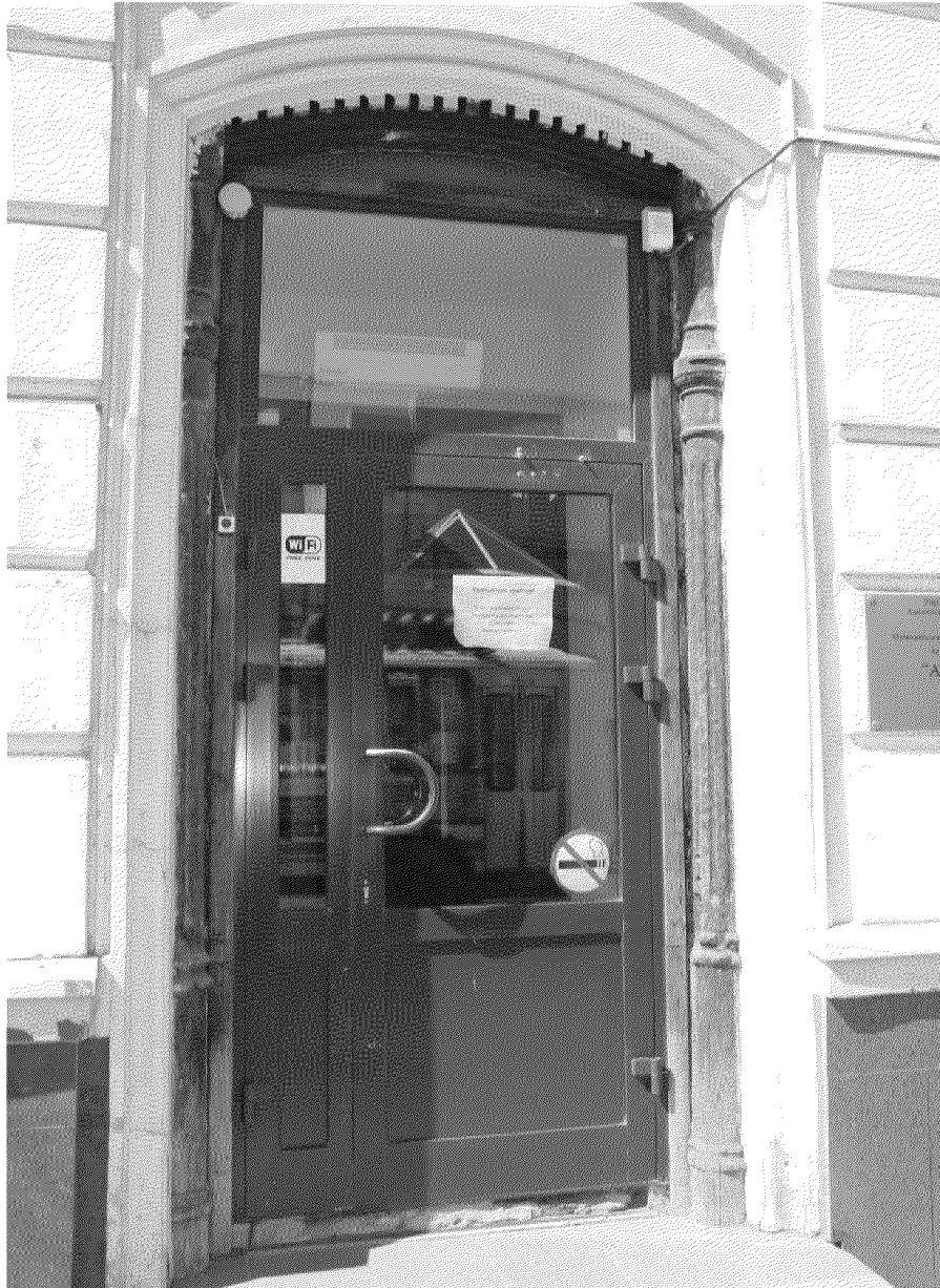
Фото № 6. Сохранившийся элемент первоначальной дверной коробки главного фасада со стороны проспекта Ленина