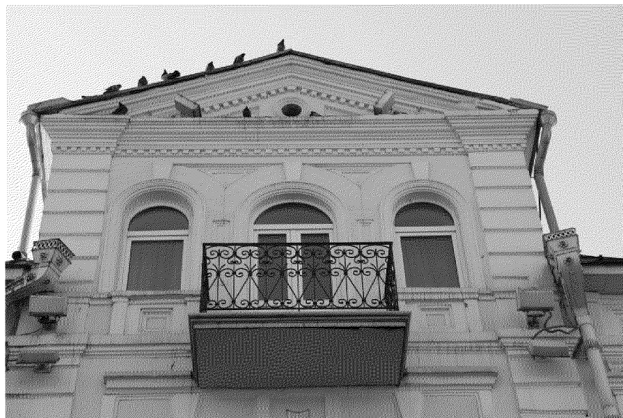
Фото № 3. Балкон главного фасада со стороны переуллка Нахановича