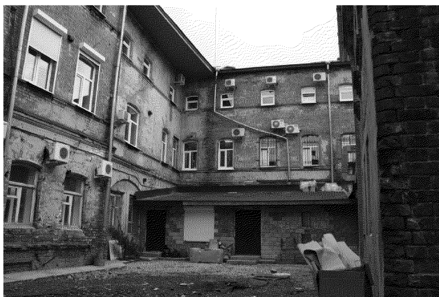
Фото № 10. Вид на дворовой фасад