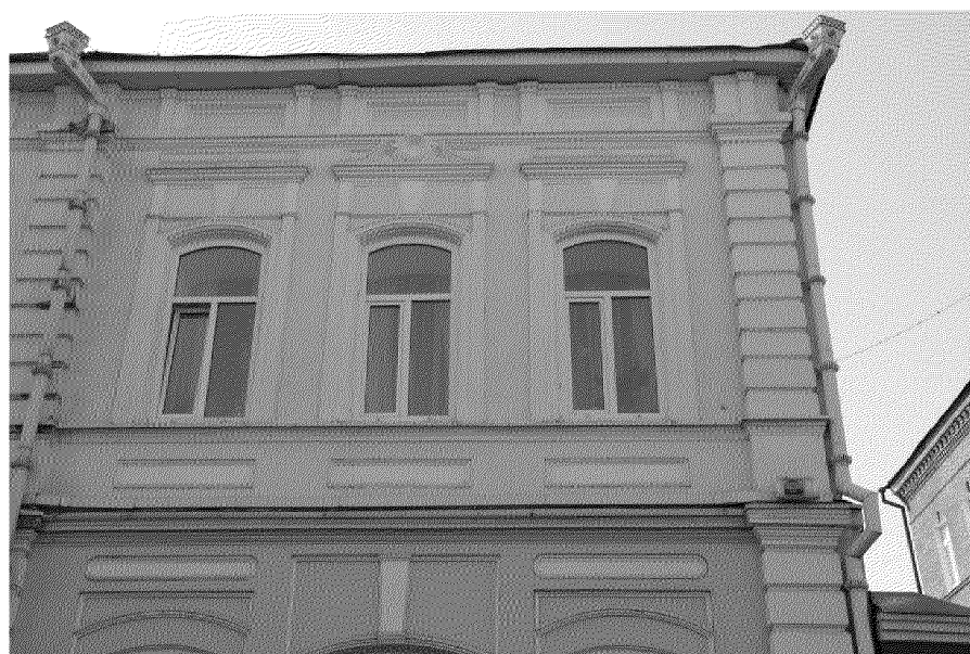
Фото № 5. Фрагмент главного фасада со стороны переулка Нахановича