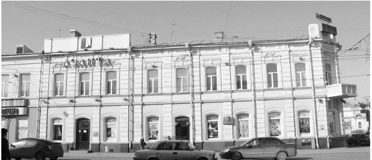
Фото № 1. Вид на главный фасад со стороны проспекта Ленина