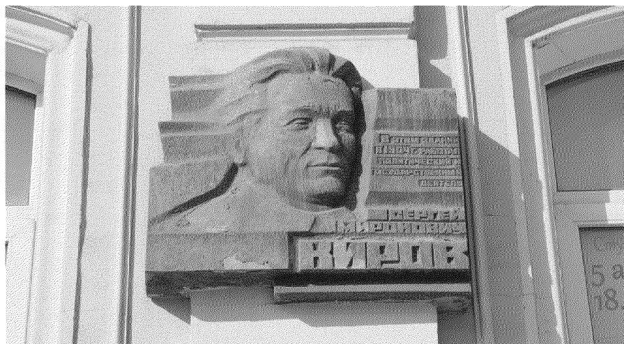
Фото № 7. Мемориальная доска, расположенная на главном фасаде со стороны проспекта Ленина