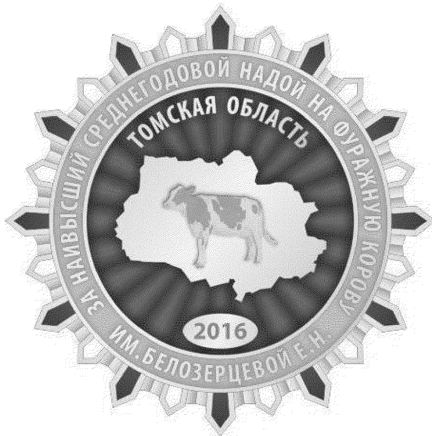
Рисунок знака «За наивысший среднегодовой надой на фуражную корову» им. Белозерцевой Е.Н.»

УТВЕРЖДЕН постановлением Губернатора Томской области от 23.09.2016 № 90