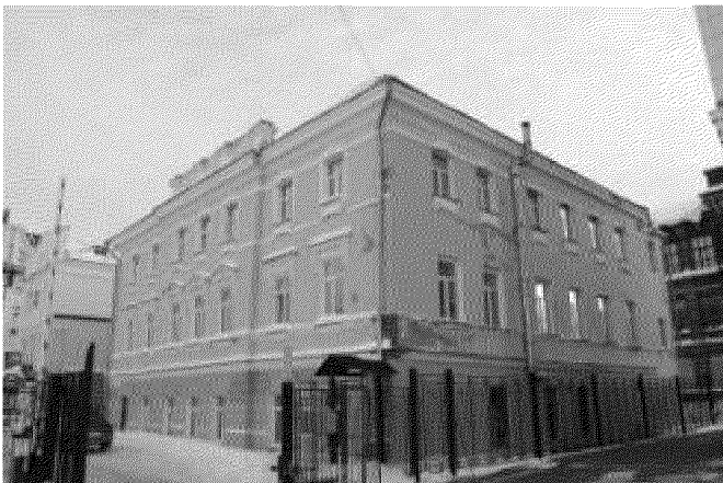
Общий вид здания со стороны южного (дворового) фасада