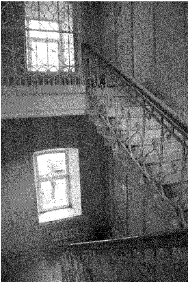
Парадная лестница (подъем на 3 этаж)