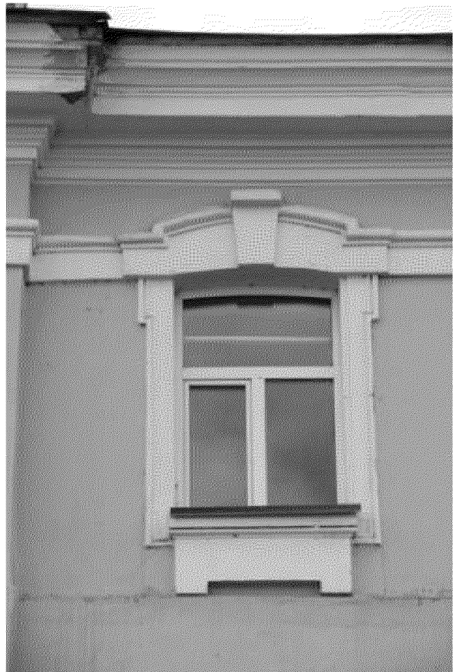
Декор окна 3-го этажа главного фасада