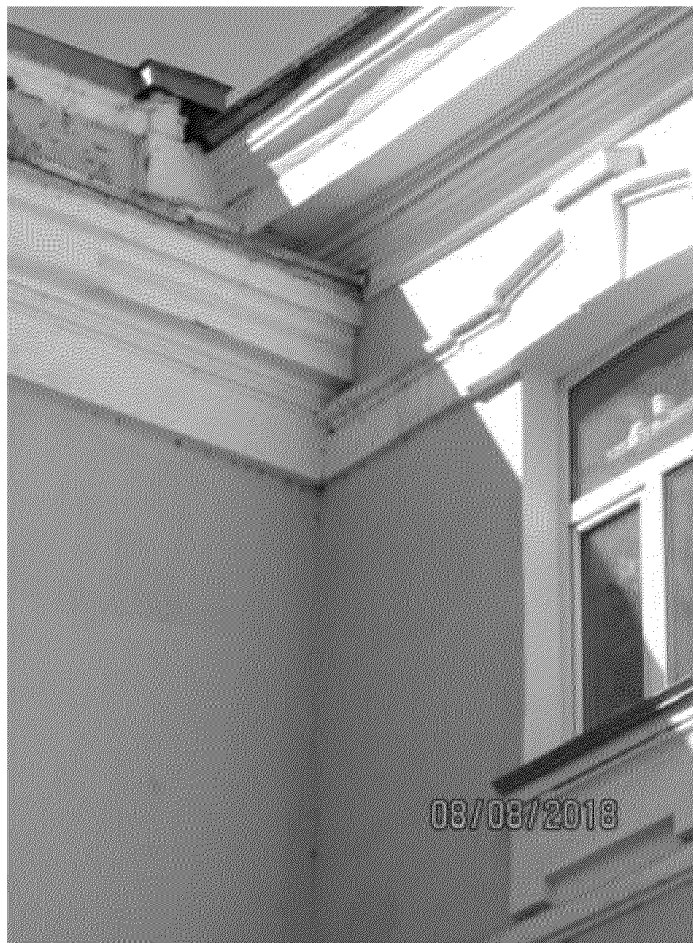
Фрагмент карниза основного объема здания и пристройки