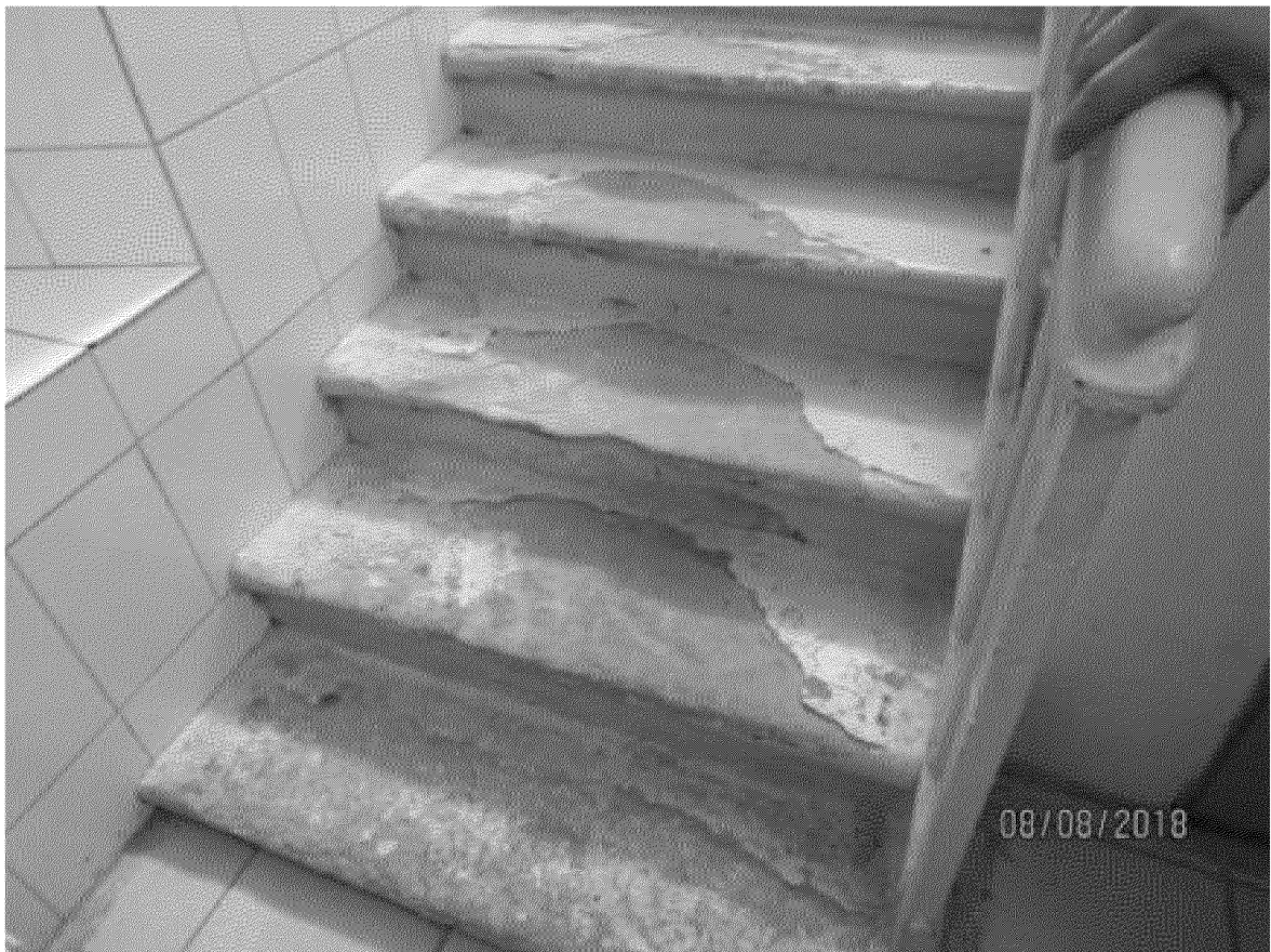
Лестница пристройки южного фасада. Ступени из песчаника