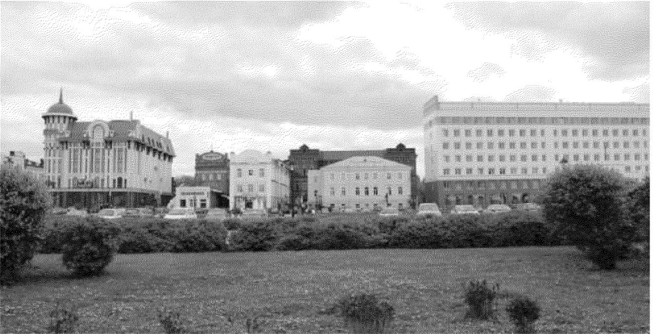
Панорамный вид застройки Набережной р. Ушайки

Фотографические изображения предмета охраны объекта культурного наследия регионального значения «Лечебница городская», 1888 г., расположенного по адресу: Томская область, г. Томск, Набережная реки Ушайки, 22