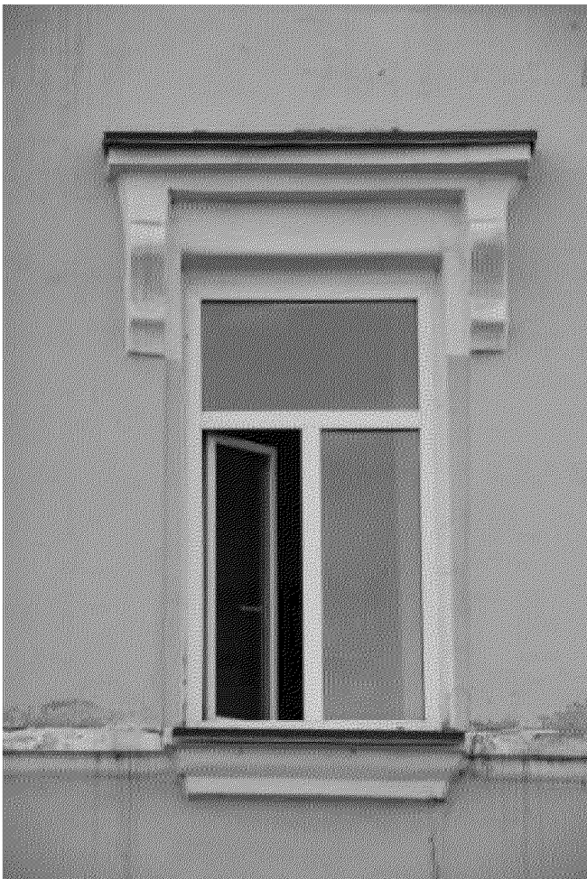
Декор окна 2-го этажа главного фасада