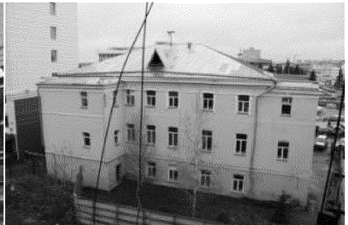
Общий вид здания с северо-западной стороны