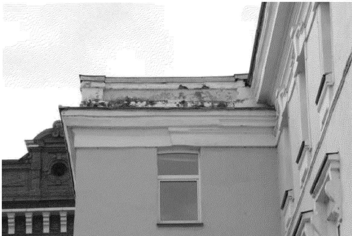
Фрагмент карниза пристройки восточного фасада здания. Парапет.