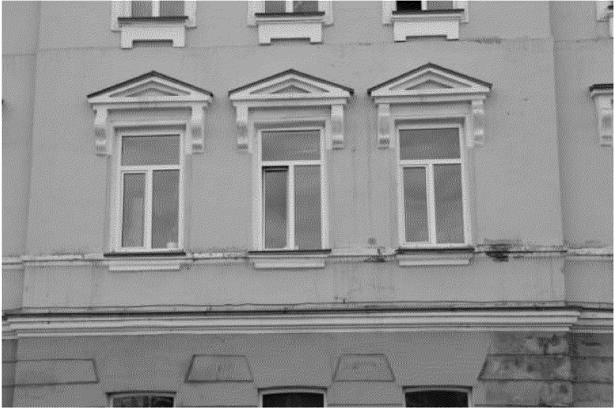
Фрагмент ризалита главного фасада. Декор окон 2-го этажа.