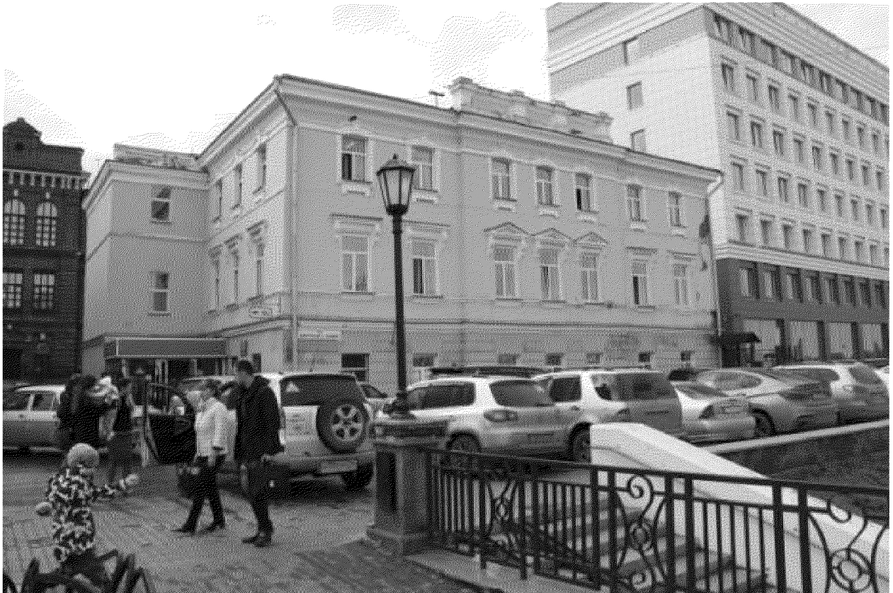
Главный фасад здания, вид с Набережной р. Ушайки