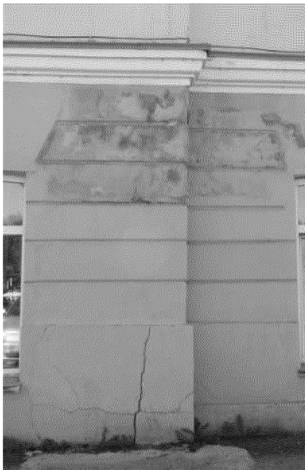
Фрагмент главного фасада. Руст 1-го этажа.