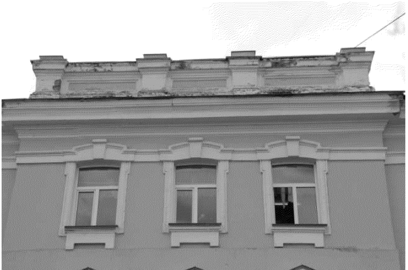
Фрагмент ризалита главного фасада. Декор окон 3-го этажа, карниз и аттик.