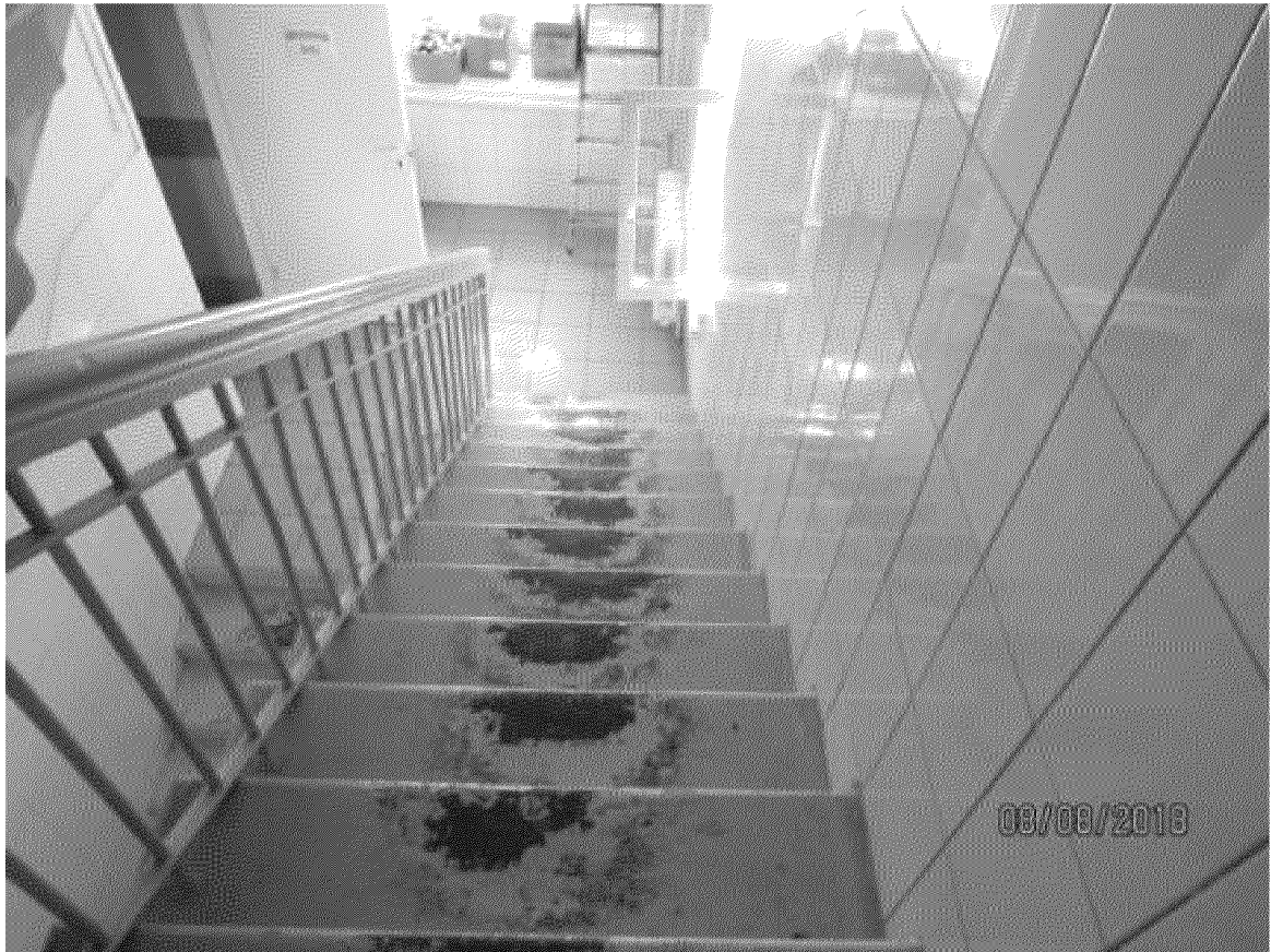
Лестница пристройки южного фасада