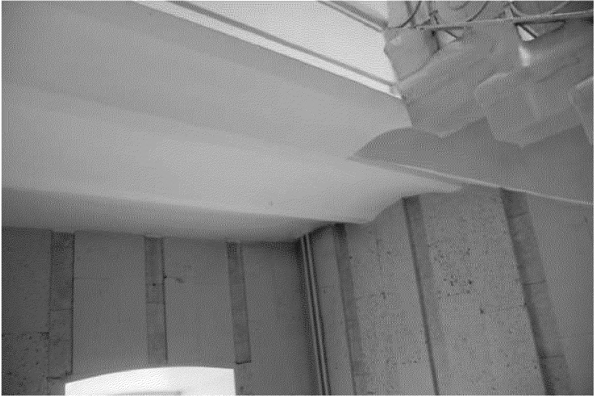
Кирпичные своды в конструкции лестничной площадки парадной лестницы